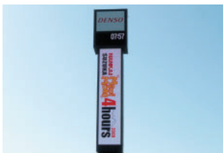
リーダーボードに表示された大会ロゴ