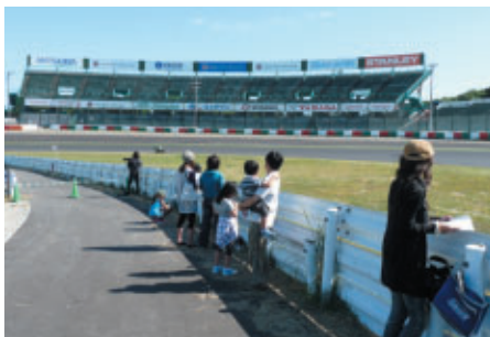
小さいからとあなどれません! 迫力の走行が間近でみることが出来る激感エリア (第1コーナーイン側…写真はST)