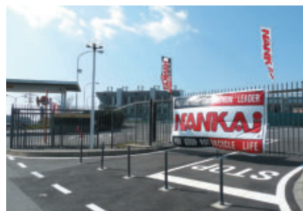
モータースポーツゲート