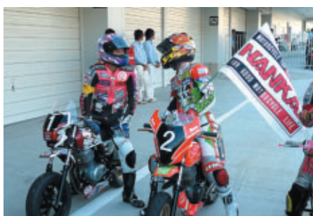
優勝チームがNANKAIフラッグを手にウィニングラン (STクラス)