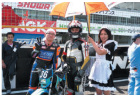
メイドさんも登場! グリッド上でも癒しは必要です

チームクルー、仲間、家族…参加したすべての人、誰もがHEROになり、場内には笑顔があふれていました。また、来年も鈴鹿でお会いしましょう!