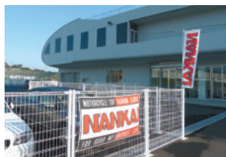
パドック内に掲出されたNANKAIのぼりと幕