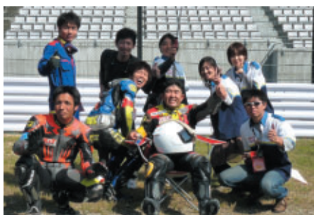
みんなでワイワイがMini-Motoの大きな魅力