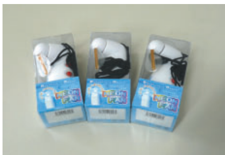
参加賞として配布された小型扇風機