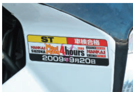
車検合格ステッカー