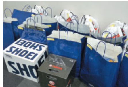
おなじみとなった豪華な副賞の数々!