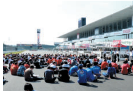
ホームストレート上大型ビジョンを使用して行われたブリーフィング