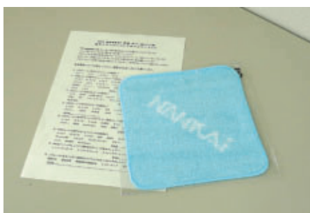
アンケートにご記入していただいた方に配布した NANKAIオリジナルハンドタオル