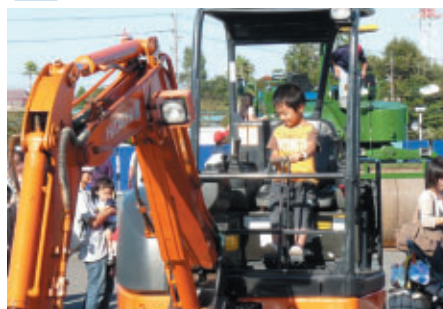
GPスクエアではショベルカー、バスなど動くクルマが大集合! 搭乗体験も行われ大盛況でした