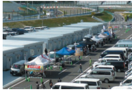
チームスイート前に展開された各社様のサービスブース (写真はOPEN)