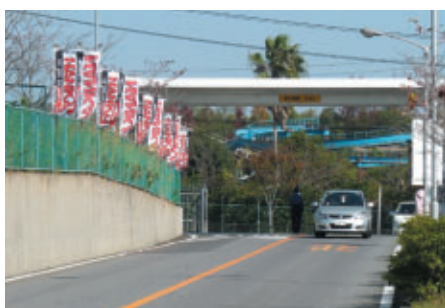
場内各所に掲出されたNANKAIのぼり