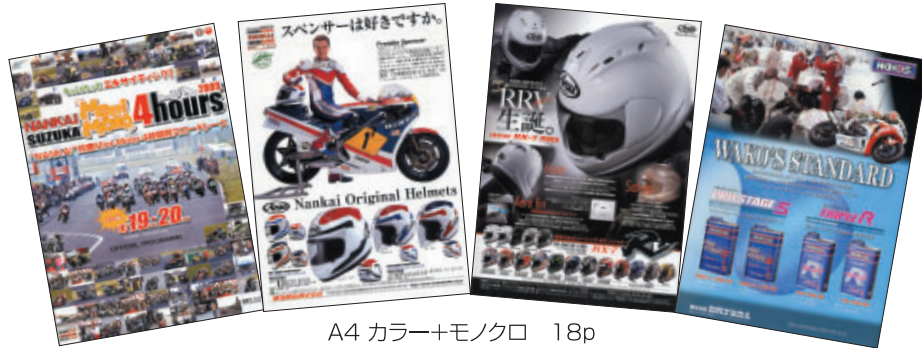
A4 カラー+モノクロ 18p