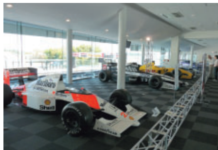
名車が勢揃い ピットビル2Fで行われた特別展示 鈴鹿サーキットコレクションホール「鈴鹿を走ったマシンたち」