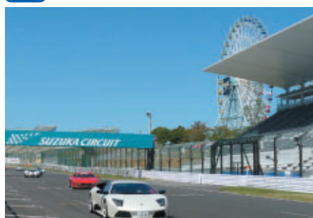
お昼のインターバルには レーシングコースをスーパーカーがパレード