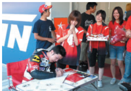
レース終了後に待っていたのは婚姻届! ミニモトで結ばれたお二人 末永くお幸せに!