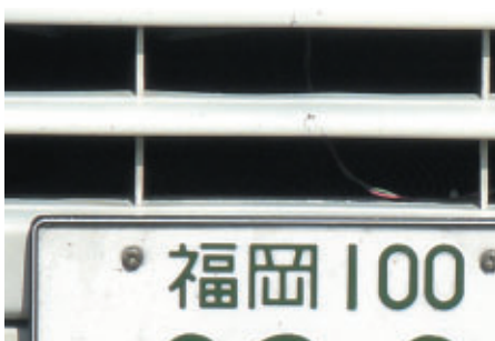
ミニモトファン全国から集合! (写真はOPEN)