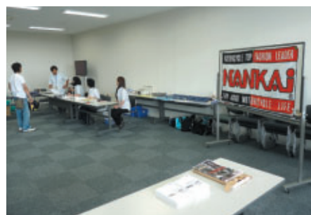
選手受付 (SMSC) 内に掲出されたNANKAI幕