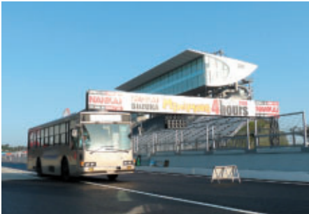
走行前にはバスでコースを下見