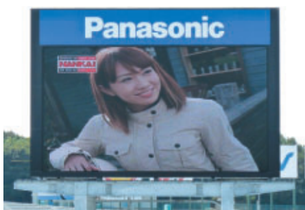
サーキットビジョンCF (3種類)