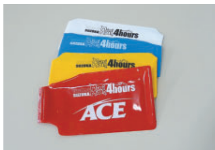
ライダー識別用腕章 赤色はACEライダー