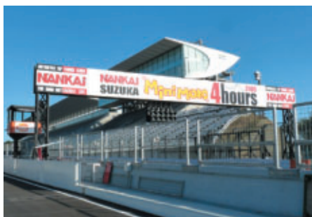
ホームストリートブリッジ

冠スポンサーとして、Mini-Motoスタート以来支えていただいている南海部品株式会社様。今回も大勢のMini-Motoファンをさまざまな角度からバックアップしていただき、大会の盛り上げにご協力いただきました。