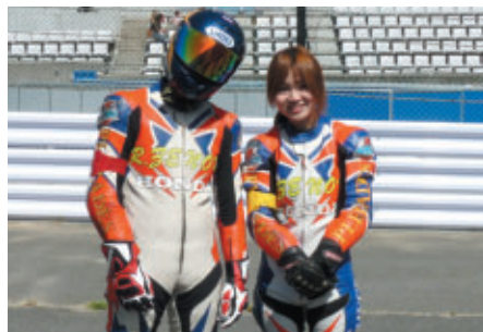
女性ライダーの参加も目立ちました