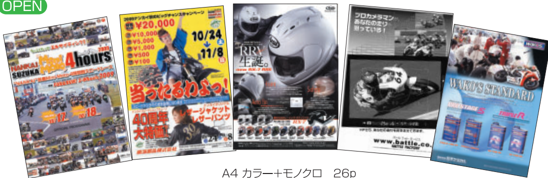
A4 カラー+モノクロ 26p