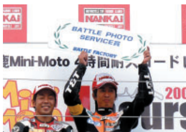
株式会社バトルファクトリー ST OPEN