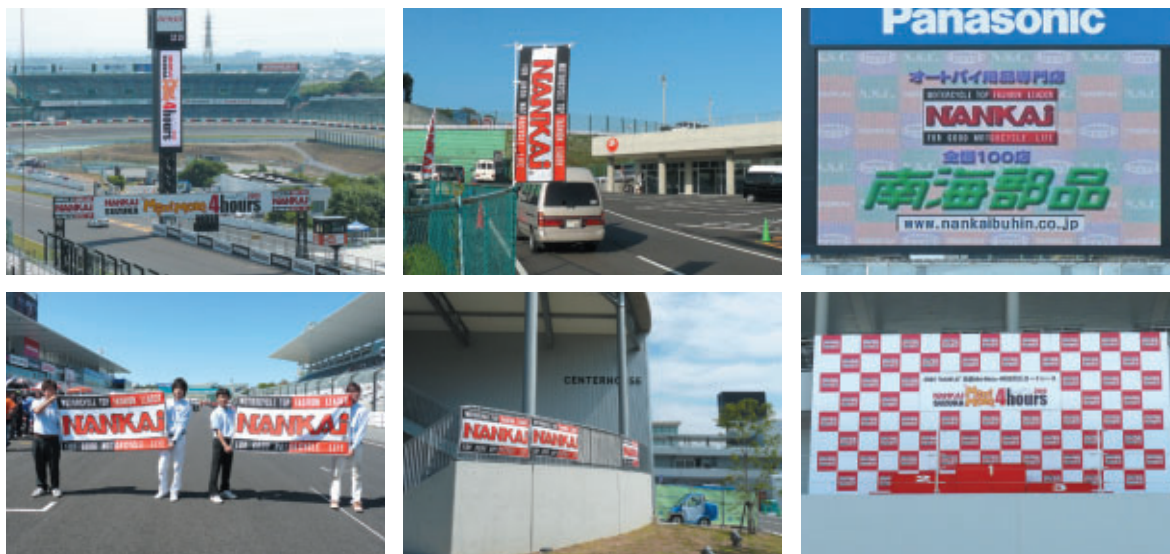
南海部品株式会社