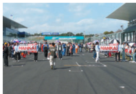
決勝スタートを二組に分け、安全を確保するNANKAI幕