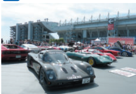
グランプリスクエアにあこがれのスーパーカーが勢揃い