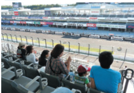
STクラスは開催日がシルバーウィークということもあり グランドスタンドには家族連れのお客様の姿も