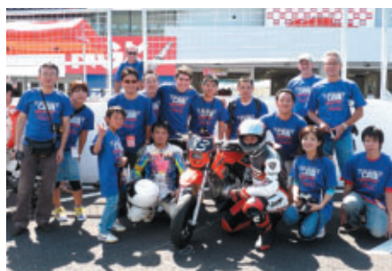
外国の方もご参加のチーム もはやミニモト人気はワールド級!