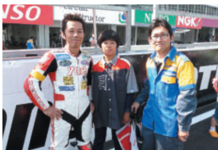
幅広い年齢層に愛されています