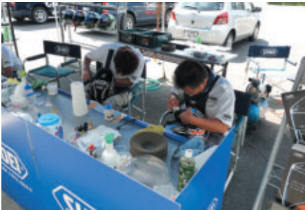
SHOEI様のブースではヘルメットの無料メンテナンスが行われました