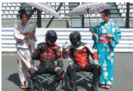
リラックスしていても、気合い十分!