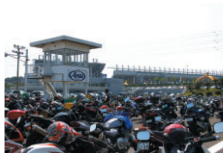
グランドスタンドにほど近い交通教育センターに設置された2輪専用駐車場