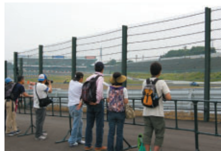
こちらはS字コースサイドの「激感エリア」(S字) ※「激感エリア」は1コーナー手前メインストレートイン側にも 設置されました