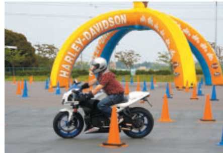
GPスクエア特設コースで開催された Buellニューモデル試乗会