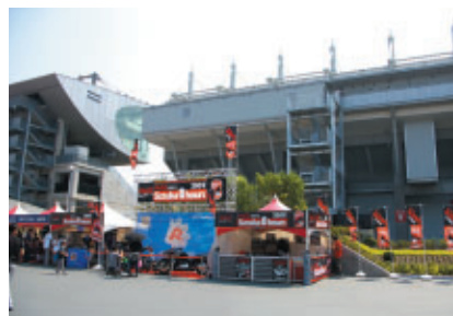
GPスクエアに設置された「"コカ・コーラ ゼロ"鈴鹿8耐ブース」鈴鹿8耐オリジナルデザインの"コカ・コーラ ゼロ"の販売やマーシャルバイク、コンセプトバイクの展示が行われました