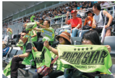
TRICK☆STAR RACING 応援団の皆さん