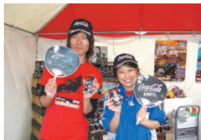
"コカ・コーラ ゼロ"鈴鹿8耐オリジナル缶とオリジナルうちわ