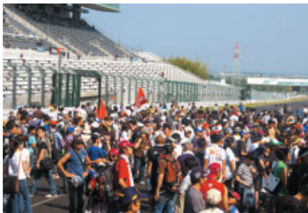
レースの熱気冷めやらぬコース上を開放して、表彰式をご覧いただきました