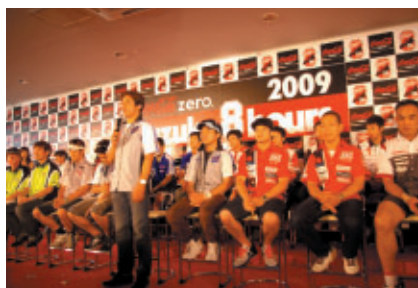
一般公開で行われた「8耐参戦発表会」(パドック内センターハウス2F)多くのライダーにご出席いただき、意気込みを語っていただきました