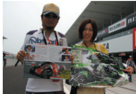
奈良からお越しのお客さま ビットウォークでの“収穫”を手にこの笑顔