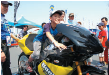
Buellレーシングマシンの迫力あるエンジンレスポンスを 体験いただいた「プリッピング体験」