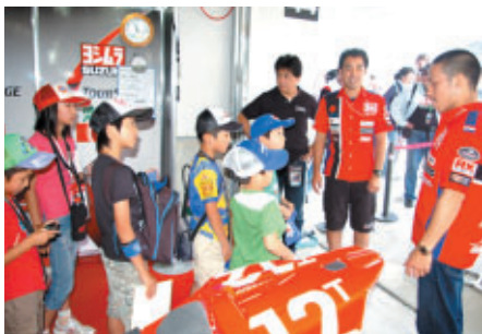
コチラレーシングファンクラブに入会された先着10名様にはヨシムラスズキ with JOMOピット訪問のビッグプレゼントが