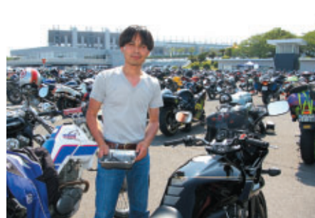
友人が参加するBuellのメカとしてご来場のお客さま その腕を生かして携っさんのバイクを整備中でした