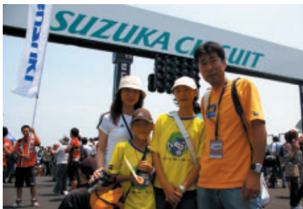
ご家族でグリッドウォークを楽しんでいたお客さまは京都から