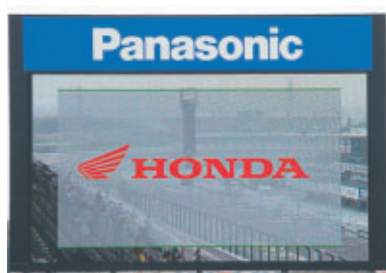
コカ・コーラ ゼロ 株式会社ブリヂストン 株式会社ホンダモーターサイクルジャパン