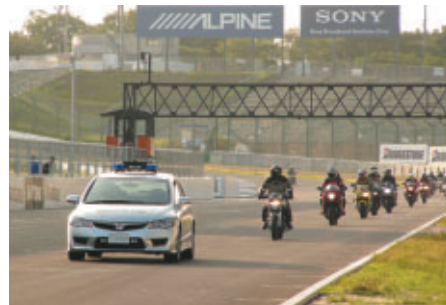
レース終了後、国際レーシングコースをマイバイクで体験走行いただいた「サーキットクルージング」