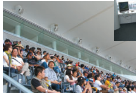
グランドスタンド上の快適な個室観戦席「パノラマルーム」のご視察会が実施されました