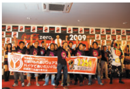
鈴鹿商工会議所青年部が前夜祭で行われる「バイクであいたいパレード」をPR今年史上最多の約800台の参加が予定されています