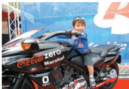
マーシャルバイクDN-01 (写真)やコンセプトバイクCBR1000RR の搭乗体験が大人気でした