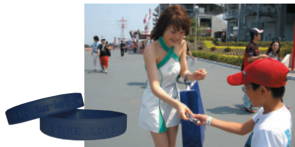
お客さまに無料配布された"LOVE BIKE.LOVE LIFE"リストバンド

"Road to 8hours"のタイトル通り8耐前哨戦として定着した鈴鹿300km耐久ロードレース。大会期間を通じてさまざまな関連イベントやプロモーションが実施され、7月26日(日)に決勝の火ぶたが切って落とされる"コカ・コーラ ゼロ"鈴鹿8時間耐久ロードレースに向けて期待が高まってきました。