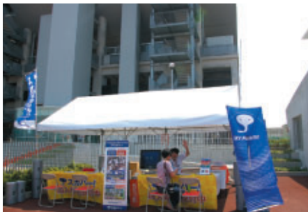
今年の8耐を完全生中継いただくスカパー! ブース