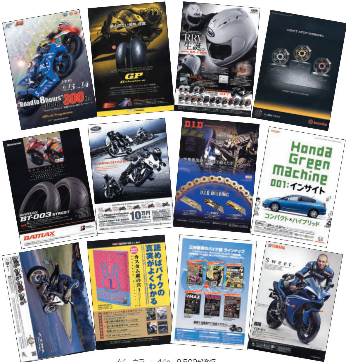
A4 カラー 44p 9,500部発行

株式会社アライヘルメット 株式会社三栄書房 株式会社D.I.D. ダンロップファルケンタイヤ株式会社