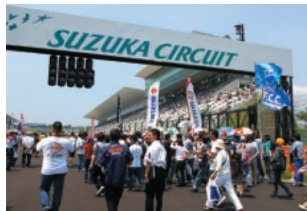
決勝スタート前の緊張感あふれるグリッドをご体感いただいた「グリッドウォーク」