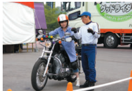
Buell試乗会会場に併設された安全運転講習コーナー