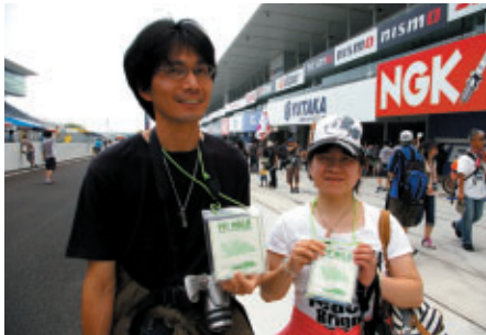
桑名からお越しのご家族連れのお客さまは10年以上にわたって鈴鹿サーキットのレース観戦を楽しんでいるそうです

バイクが好き、レースが好き、鈴鹿が好き・・・ たくさんの笑顔に出会えた週末でした また8耐でお会いしましょう!