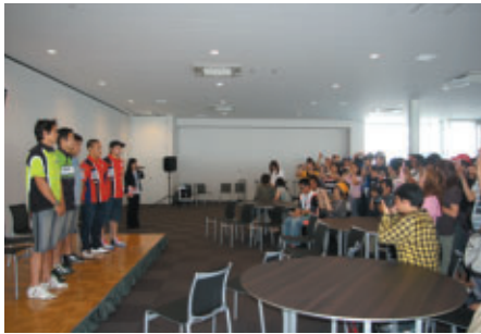
ホスピタリティラウンジ・テラスご利用のお客さまを対象に実施されたライダートークショー