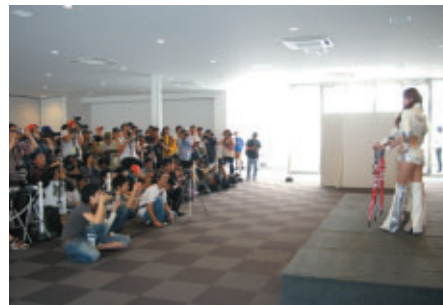
ホスピタリティラウンジ・テラスへご入場可能なパスをお持ちの方を 対象に行われた「キャンギャルフォトセッション」