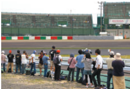
パドックに入場可能なパスをお持ちの方にお楽しみいただいた 「激感エリア」(1~2コーナーイン側)