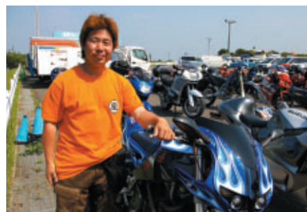
こちらのお客さまは広島から 「こんどは愛車のBuellでレースに出ようかな...」