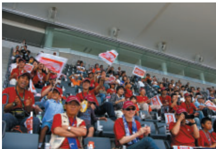
MUSASHI RT HARC-PRO 応援団の皆さん