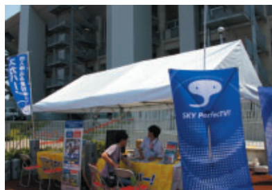
ハーレーダビッドソンジャパン株式会社 スカパーJSAT株式会社