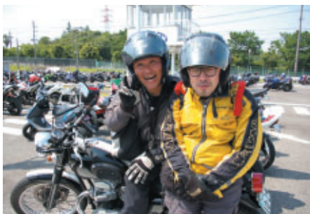
東京から日帰りでご観戦のお客さま 元気いっぱいタンデムランで帰路につかれました