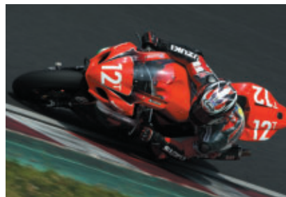
3位のヨシムラスズキ with JOMO(酒井大作選手)