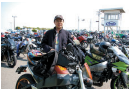
Buellオーナーのお客さまは千葉から日帰り 「もてぎにはよく行くのですが鈴鹿は初めて 8耐も来たいです」