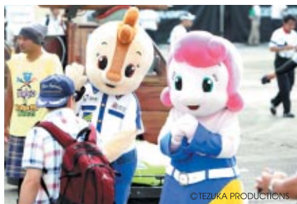
大会期間中、ゲートオープン時にはコチラファミリーが とちぎテレビで放映中の「こちらdeダンス」でお客さまをお迎えしました