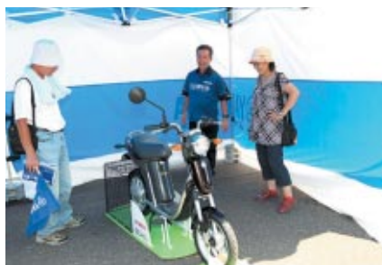
電動バイクEC-03が展示されたヤマハブース 多くのお客さまの注目を集めていました