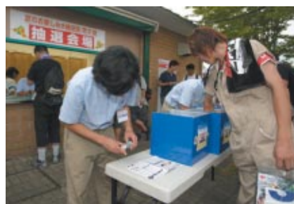
ご来場のお客さまを対象に、ホテルツインリンク宿泊券など豪華賞品が当たる「夏のお楽しみ抽選会 第二弾」