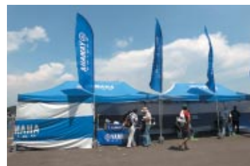
ヤマハ発動機株式会社