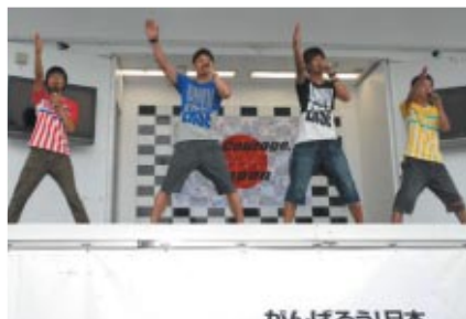
若手レーシングライダー4人のユニット「R4」のミニライブに大きな声援が飛んでいました