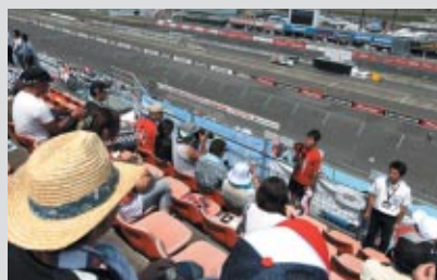
グランドスタンドに設けられた専用エリアへのドライバー訪問