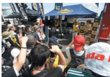
キグナスイメージガールによるPRイベントが行われた SUNOCOブース