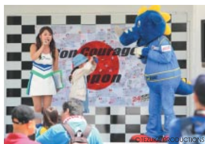
コチラーレーシングと一緒にモータースポーツを学べる「コチラーレーシングの わかるかな? モータースポーツ講座」