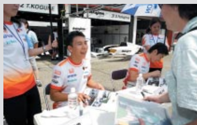
チームサポーターズシート前売りご購入のお客さま限定で 行われたサイン会(ピットロード)

フォーミュラ・ニッポン各チームのサポーターのために設定された「チームサポーターズシート」 今回もさまざまな趣向でお楽しみいただきました。