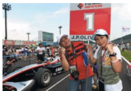
フォーミュラ・ニッポンのスタート進行をお手伝い いただいたグリッドボードキッズ(事前にウェブにて公募)