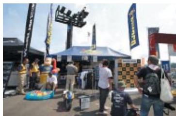
日本サン石油株式会社