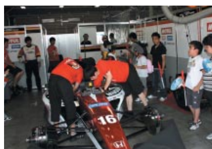
茂木町、JRP、そしてツインリンクもてぎでは福島県相馬市教育委員会を 通じて小学生と保護者をご招待、各チームピット訪問などを 楽しんでいただきました