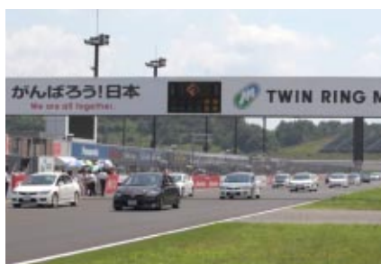
シビックワンメイクレースのラストイヤーを記念 して行われたシビックオーナーズパレード