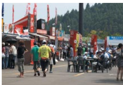
栃木県、茨城県、群馬県の素材を生かした「B級グルメフェア」を 場内飲食店舗で展開しました イベント限定メニューなど大好評でした