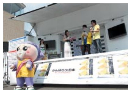
いばらきメロンが当たるクイズステージ おなじみの「ハッスル黄門」も登場