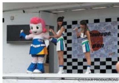
続いてはツインリンクもてぎエンジェルのPRタイム トライアル日本GP、インディジャパン、MotoGPなどイベント目白押しです