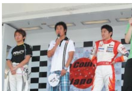
フォーミュラ・ニッポン参戦ドライバーのグッズを対象にした東日本大震災被災者のための「チャリティーオークション」