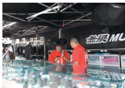
ブラックを基調とした無限グッズがラインアップされた M-TECブース