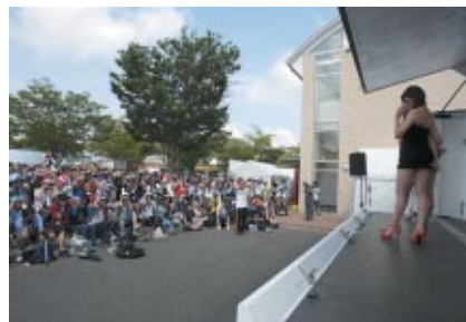
各チームのマスコットガールなどが一堂に会した「キャンペーンガールオンステージ」