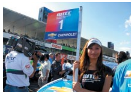
三重県内の美少女が登場するフリーペーパー「三重美少女図鑑」のモデルたちがWTCCのグリッドガールをつとめました