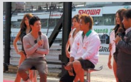
日本人選手の応援に駆け付けたF1ドライバー小林可梦偉選手(左) 親友の吉本大樹選手(中)にエールを送りました