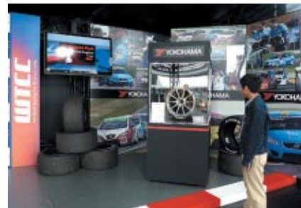
WTCCで使用されるレーシングタイヤを中心としたWTCC紹介コーナー