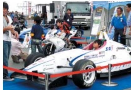
GPスクエアの「コチラレーシング」&SRS（鈴鹿サーキットレーシングスクール）ブースでは、レーシングマシン体験搭乗が人気を呼んでいました