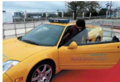
メインゲート先のウェルカムひろばで行われたマーシャルカー-NSX体験搭乗