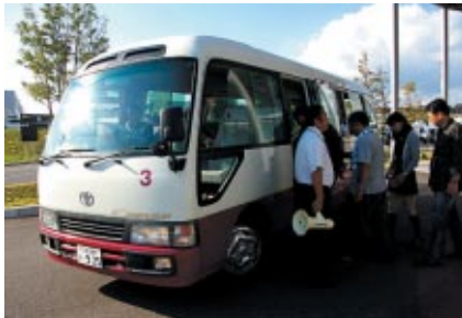
1レースあたり30分たらずの超スプリントレースのため、各「激感エリア」をシャトルバスで連絡しました