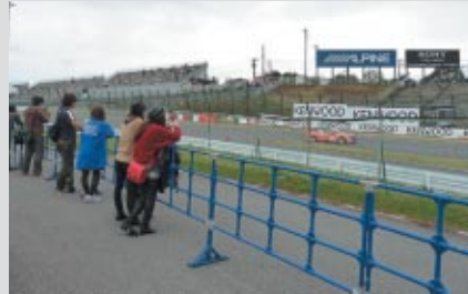
最終コーナーイン側