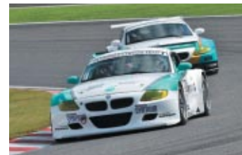
ST-1クラス優勝のPETRONAS SYNTIUM BMW Z4M COUPE

フルコースを舞台に同日開催されたスーパー耐久シリーズ 鈴鹿300kmは、終盤に同チームの争いとなりましたが、柳田真孝/D.アン/谷口信輝組が0.228秒差で逃げ切りました。