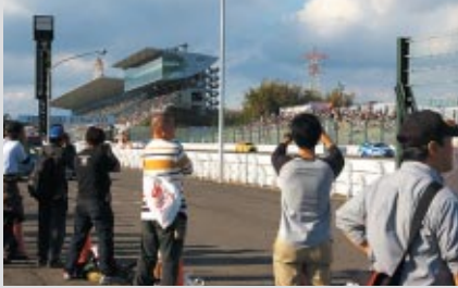
1コーナー手前ストレートイン側

大迫力のWTCCを五感で感じていただこうと、おなじみの「激感エリア」を4カ所設置し、パドックバスをお持ちのお客さまにお楽しみいただきました。