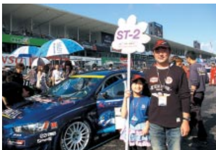
スーパー耐久各クラスのグリッドキッズは、抽選で選ばれた子どもたちがつとめました