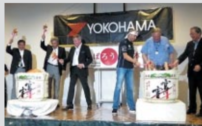
関係者一同による鏡割りと振る舞い酒