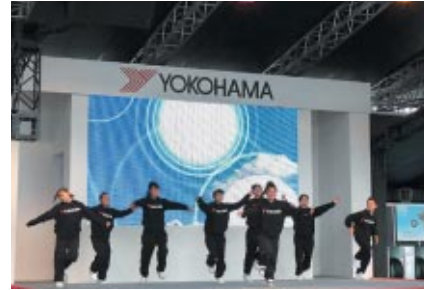
スーパーキッズによるダンスパフォーマンス