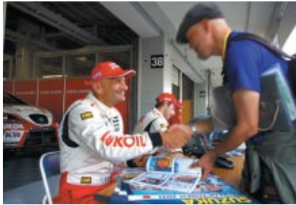
ピットウォーク中に行われたドライバーサイン会