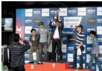
ブース内に設けられたWTCCの表彰台を模したステージ