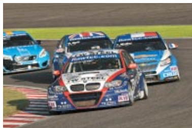
RACE2優勝のT.コロネル選手