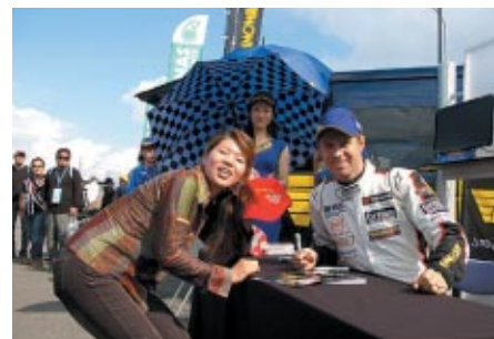
MONROEブースで行われたティエゴ・モンテイロ選手のサイン会

PICK UP 2 決勝レース前には華やかにオープニングセレモニー&アトラクションが開催されました。