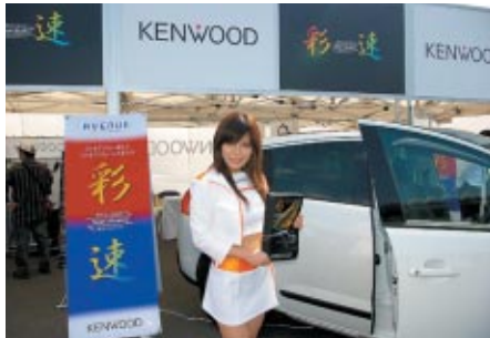
KENWOODブースでは最新カーナビ「彩速」をPR