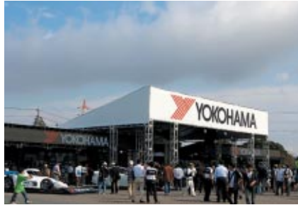
GPスクエアに設置されたYOKOHAMAブース

WTCCとスーパー耐久のワンメイクタイヤサプライヤーである横浜ゴム様には、GPスクエアでのプロモーション展開をはじめ、多彩に大会を盛り上げていただきました。