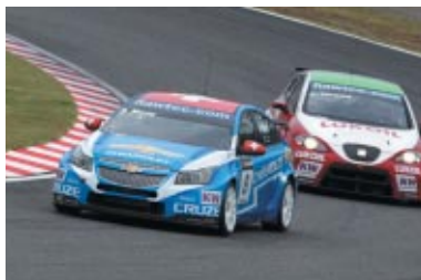
RACE1優勝のA.メニュ選手