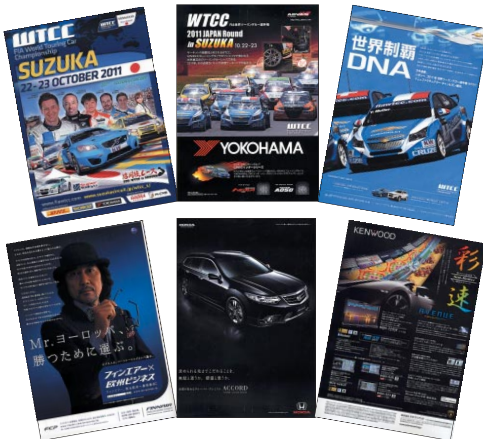
A4 カラー 72p 25,000部発行