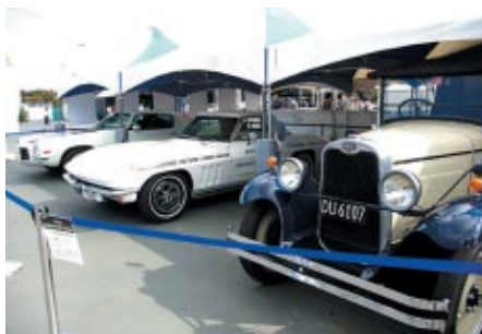
ゼネラルモーターズ・ジャパンブースには歴代のシボレーの名車が一堂に