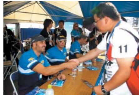
ゼネラルモーターズ・ジャパンブースで行われたシボレードライバーサイン会