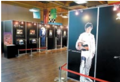
遊園地内「ブッチタウンセンター」で開催されている「可夢偉伝」小林可夢偉選手の歩みを貴重なグッズ展示とともに紹介しています（12月25日〈日〉まで）