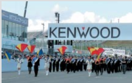
龍谷大学吹奏楽部の皆さんがパレードを先導

PICK UP 2 決勝レース前には華やかにオープニングセレモニー&アトラクションが開催されました。