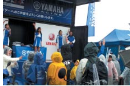
YAMAHAブースで行われた、豪華賞品が多数当たるじゃんけん大会