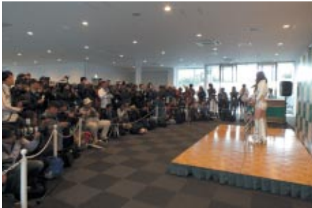
パドックバスをお持ちの方を対象に開催された「キャンペーンギャルフォトセッション」