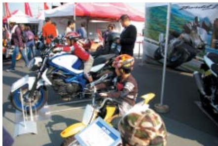
SUZUKIブースで行われたニューモデル搭乗体験