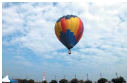
空のモビリティ、熱気球の係留飛行体験が鈴鹿サーキット駐車場で 開催されました