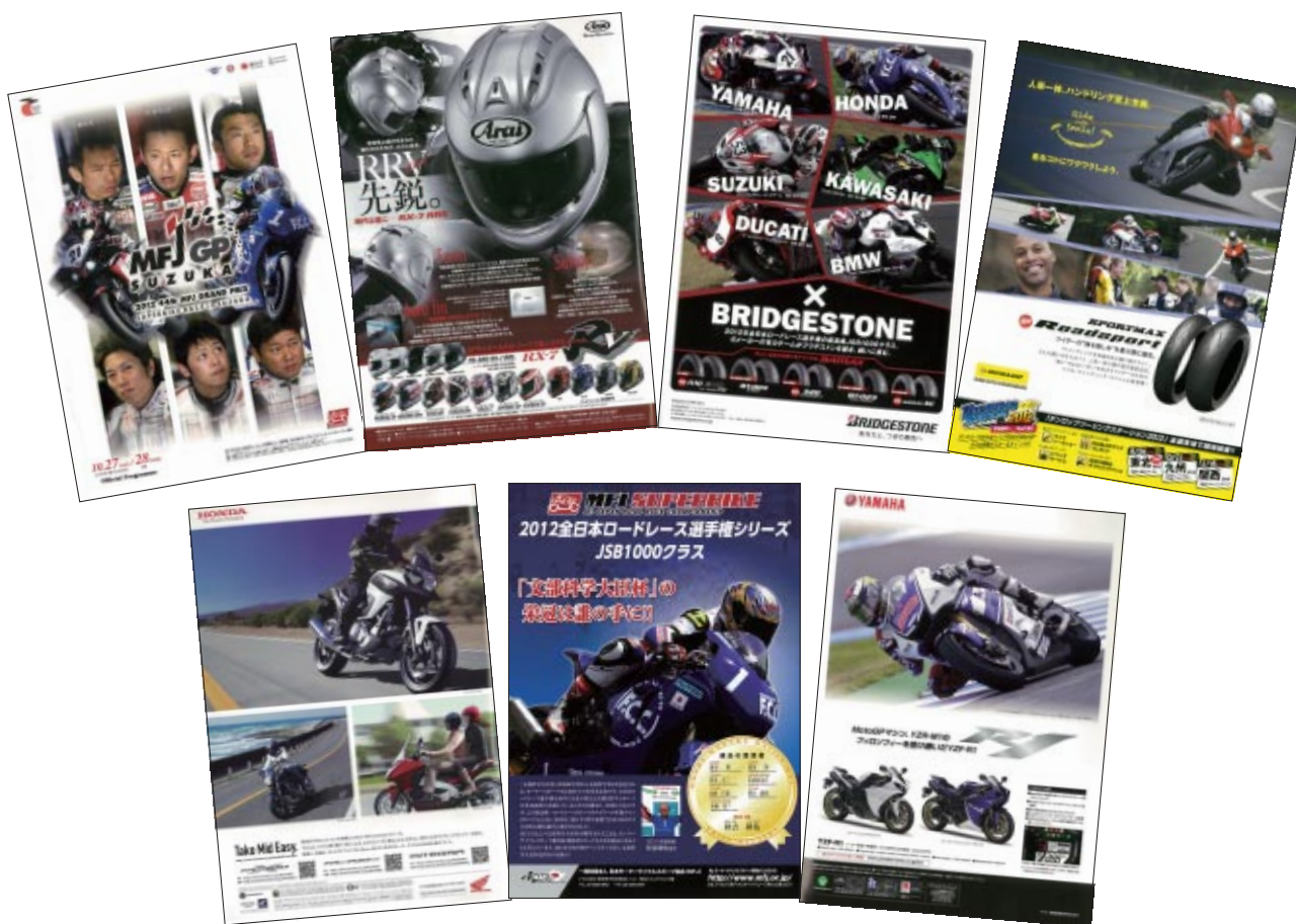
A4 カラー 44p 9,000部発行

株式会社アライヘルメット 株式会社三栄書房 住友ゴム工業株式会社 一般財団法人日本モーターサイクルスポーツ協会