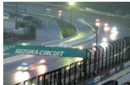
全スケジュール終了後、国際レーシングコースをご自分のバイクで体験走行いただいた「サーキットクルージング」