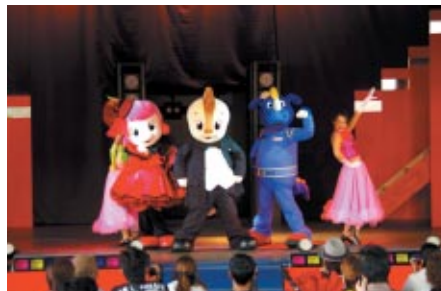
コチラファミリーが鈴鹿サーキット50周年をお祝いするダンスショー (ゆうえんち内モビステージ)