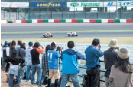
パドックバスをお持ちの方に迫力の走りを間近でご覧いただける好評の「激感エリア」を3カ所設置しました(写真は2コーナーイン側)