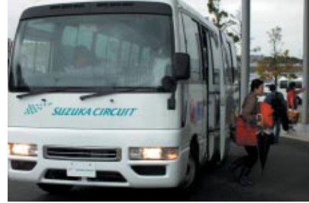
「激感エリア」に手軽にアクセスいただける「パドックシャトル@激感」を無料運行しました