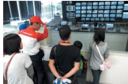
コチラレーシングカートでライセンス作成+コチラレーシングファンクラブ入会の方を対象にレース運営の中枢部分をご見学いただいた「コチラレーシング ファミリーパドックツアー」