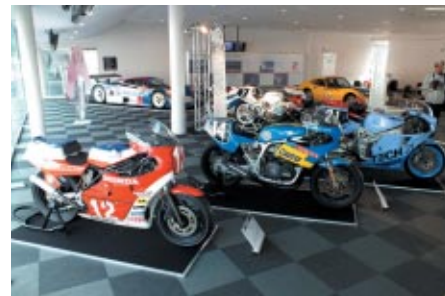
ピット2Fホスピタリティラウンジで行われている「鈴鹿サーキット50周年 タイムマシン展示」 2輪・4輪の名マシンが一堂に会しています(11月4日<日>まで)