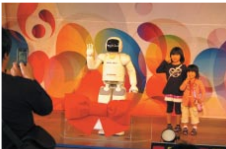
ASIMOは今年12歳 お友だちとの記念撮影会が実施されました (ゆうえんち内モビステージ)