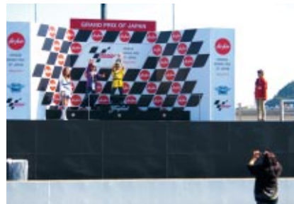
決勝表彰式が行われるポディウムをキッズ限定でフォトコーナーとしてご登壇いただきました