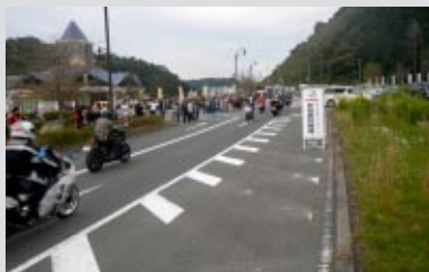
国道123号線(R123)をパレードしながらツインリンクもてぎへ向いました

主催：グランプリロードR123/レレード実行委員会(構成団体：茂木町、道の駅もてぎ、ツインリンクもてぎ) 協力：茂木警察署、株式会社「出版 クラブハーレー」編集部、株式会社「出版 DUCATI Magazine」編集部、株式会社「出版 培倶人」編集部、株式会社「出版 ライダースクラブ」編集部、株式会社クレタ L+Bike編集部、株式会社、株式会社クレタ タンデムスタイル編集部、株式会社 三栄書房 ストリートバイカーズ編集部、株式会社 三栄書房 ライディングスポーツ編集部、週刊バイクTV、株式会社とちぎテレビ、栃木県警本部、栃木県警本部交通機動隊、株式会社 内外出版社 ビッグマシン編集部、株式会社 内外出版社 ヤングマシン編集部、株式会社 二輪車新聞社 二輪車新聞編集部、株式会社バイクプロス ガルル編集部、株式会社バイクプロス ロードライダー編集部、株式会社Voice Publication MOTO NAVI編集部、真岡線SL運行協議会、真岡鐵道株式会社、株式会社モーターマガジン社オートバイ編集部、株式会社モーターマガジン社 GOGGLE編集部、株式会社モーターマガジン社 Mr.Bike BG編集部、株式会社 八重洲出版 別冊モーターサイクリスト編集部、株式会社 遊風社 BIKERS STATION編集部 後援：国土交通省、観光庁、栃木県、栃木県交通安全協会、栃木県二輪車安全普及協会、社団法人 栃木県観光物産協会、茂木町観光協会、茂木町教育委員会、茂木町商工会、一般財団法人 日本モーターサイクルスポーツ協会(MFJ)、NMCA日本二輪車協会