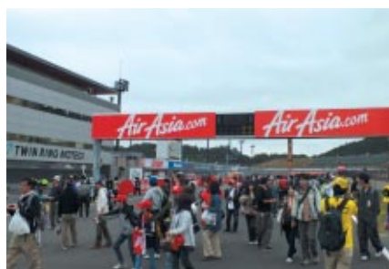
全レース終了後にロードコースを開放 お客さまに熱戦の余韻をお楽しみいただきました