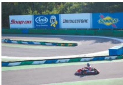
C.スーナー選手が出したレーシングカートのタイムを上回るかタイムの下3ケタが同じのお客さまにレパソルホンダチームグッズをプレゼントしました