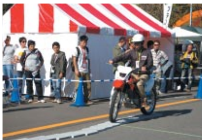
ブロックを屈折させてつくった一本橋にトライ 上位記録者には来年のMotoGPペアチケットがプレゼントされました