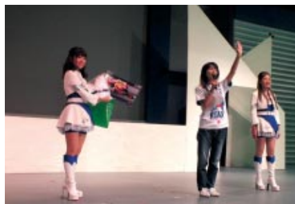
MotoGPライダーサイン入りグッズなどが出品された「チャリティーオークション」(13日 ファンファンラボ) 収益金は日本赤十字社を通じて東日本大震災で被災された方への義援金として寄付されます