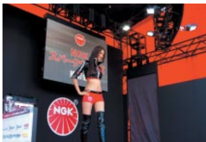
NGKブースで行われた「NGKスパークガールズ」撮影会