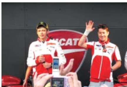
DUCATIブースで行われたV.ロッシ選手(左)とN.ヘイデン選手のトークショー