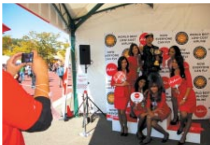
大会冠スポンサーのAirAsiaブースでは、キャビンアテンダント達との記念撮影が大人気

世界の頂点を目指して、激しく華やかな戦いが展開されるMotoGP™世界選手権シリーズ。グランドスタンドプラザを舞台に各パートナー様のPRブースではプロモーションイベントが多彩にくりひろげられました。〈順不同・敬称略〉