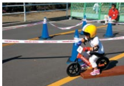
小さなお子様をお持ちのファミリーを中心に話題を呼んでいるストライダーの体験コーナー 体験レースも実施されました