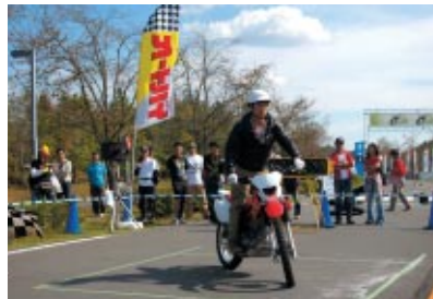
3m四方の枠の中で以下に長くともまれるか飛び入り参加で競った「バランス王座決定戦 スト・ぼっ」 上位には素敵な賞品がプレゼントされました 協力:月刊オートバイ