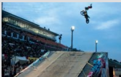
国内外で活躍する「MX-VIRUS」メンバーによるフリースタイルモトクロスショー

恒例となった前夜祭。今年は「MotoGP™クラブナイト」と題して13日(土)夜、スーパースピードウェイを舞台に音と光の演出とDJクラブのノリで熱く盛り上がりました。