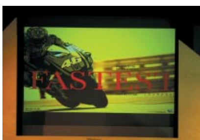
MotoGPドキュメンタリー映画「FASTEST(ファステスト)」のプレミアム試写会が13日(土)にファンファンラボで行われました ※写真はファンファンラボステージのPR画面