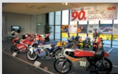
1990年代のGPマシンを展示

Honda Collection Hallでは、ツインリンクもてぎが開業した1997年を中心に活躍したレーシングマシンの特別展示「'90s Racing Collection」を11月30日(金)まで開催しています。