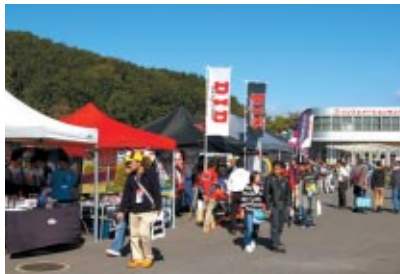
全国各地のバイクショップやパーツメーカーが一堂に会した「カスタムストリート」