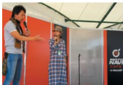
バイク雑誌MOTO NAVIとコラボしたおなじみの「MOTO NAVI CAFE」 さまざまなゲストとのトークなどでお楽しみいただきました