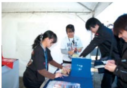
バイクでご来場のお客さまを対象に豪華賞品が当たる抽選会を実施しました