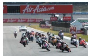
Moto3クラス スタートシーン

※詳細なレポート・リザルトは以下をご参照ください。 ツインリンクもてぎ公式ウェブサイト http://www.twinring.jp/ MotoGP公式ウェブサイト http://www.motogp.com/