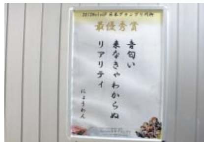
ツインリンクもてぎ公式サイトで事前に応募いただき、サイト閲覧者の投票で選ばれた日本「2012年MotoGP日本グランプリ川柳」10撰最優秀賞はご覧の作品です