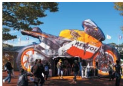
MotoGPマシンを模したGAS JAPANブース