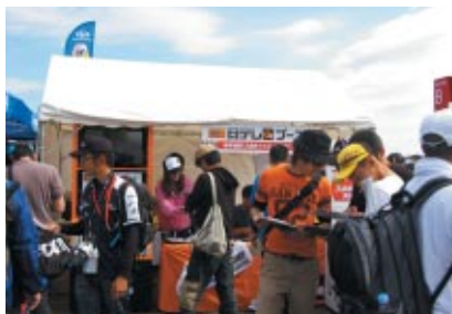
MotoGPクラス決勝上位3人を予想してグッズが当たるクイズが行われたG+ブース