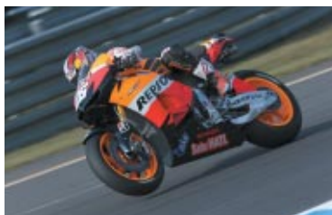
MotoGPクラス 日本GP2連覇のペドロサ