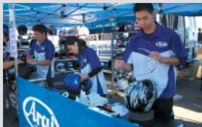
アライヘルメットブース

アライヘルメット、SHOEI各社様による恒例のヘルメット無料メンテナンスサービスが実施され、バイクでご来場のお客さまの好評を博していました。