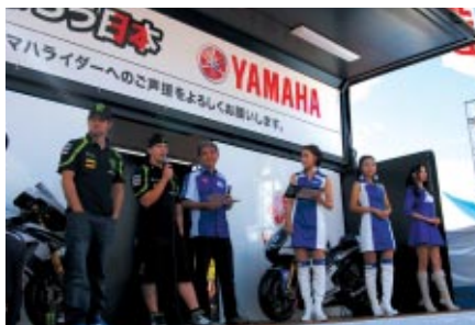
YAMAHAブースで行われたC.クラッチロー選手とA.ドヴィツィオーゾ選手のトークショー