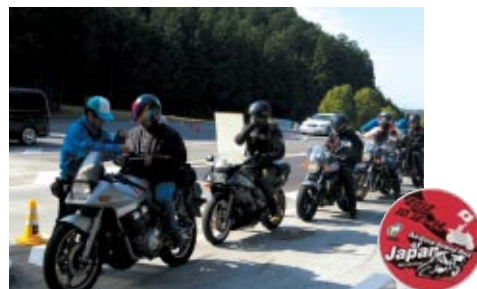
バイクでご来場のお客さまに日本グランプリ限定のピンズと500円金券をキャッシュバックしました