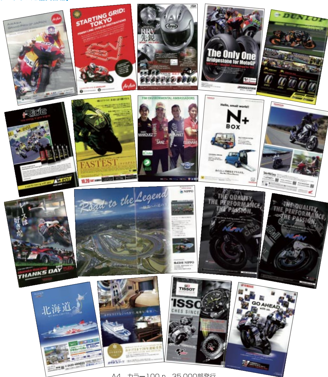
A4 カラー100p 35,000部発行

株式会社アライヘルメット AirAsia ENI 株式会社カーグラフィック 株式会社三栄書房 商船三井フェリー株式会社