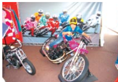
オートレーサーへの搭乗体験が行われたMFJブース