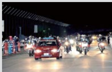
「グランプリロードR123/レレード」(下記参照)の参加者がスーパースピードウェイをパレード