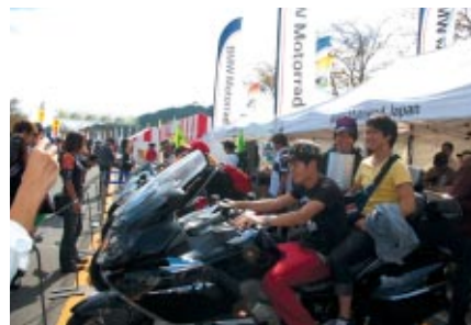
ニューモデルの展示・搭乗体験が行われたBMWブース