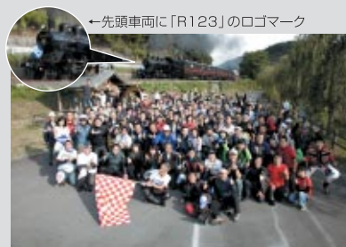
スタート地点の「道の駅もてぎ」ではSLをバックに記念撮影を行いました