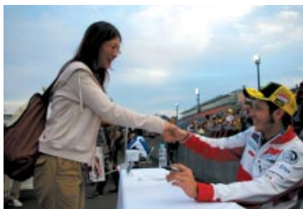
抽選で選ばれたファンの皆さまを対象に行われた「MotoGPライダーサイン会」(13日(土) スーパースピードウェイ)