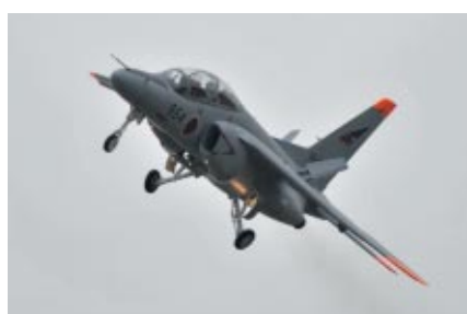
航空自衛隊百里基地 第7航空団所属「T-4」による歓迎フライトがMotoGP決勝前に行われました