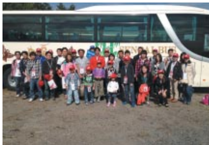
元世界GPライダー伊藤真一さんが東日本大震災で被災された株式会社ケー-bin角田工場の従業員とご家族を本大会に招待しました