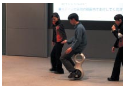
Honda Collection Hallで2日間限定で行われた「U3-X乗車体験」。 各日5名の幸運なお客さまが一輪モビリティU3-Xを体験されました。