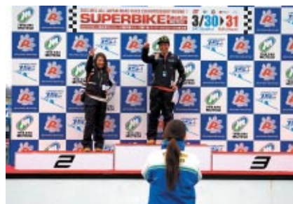
実際に使われるボーディウム(表彰台)にご登壇いただいた「ほんものボーディウム体験」。