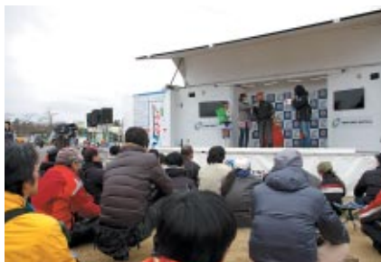
千葉テレビ制作のバイク番組「週刊バイクTV」とのコラボ企画「勝手にツーリングアワード2013」。バイクでご来場のお客さまを対象に豪華プレゼントが贈られました。