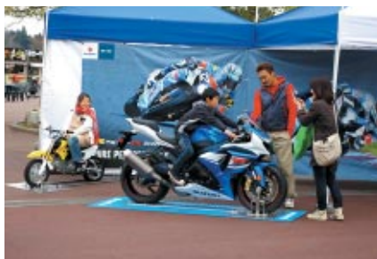
Suzukiブースではニューモデルの搭乗体験が人気でした。