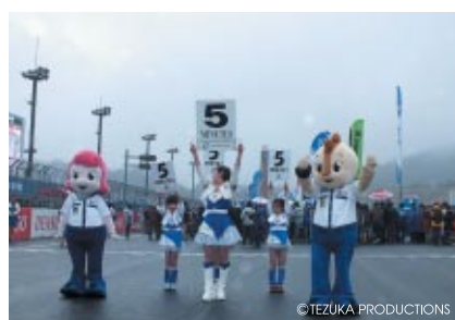
JSB1000クラススタート前のカウントダウンボード提示を可愛いエンジェルたちにお手伝いいただきました。