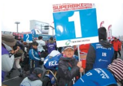
JSB1000クラスのグリッドをエスコートしていただいた「グリッドキッズ」。