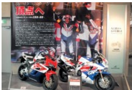
Honda Collection Hallでの特別展示「スーパースポーツの頂点へ～公道生まれ、サーキット育ち CBR-RR～」。 ※4月30日(火)まで