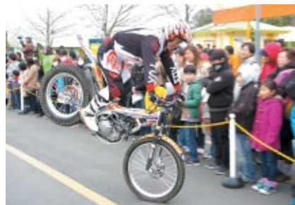
4月27、28日に開催される「トライアル世界選手権STIHL日本グランプリ」に先駆けて披露されたトップライダーの華麗なデモ走行。