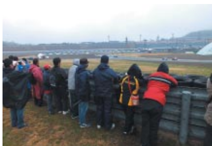
迫力の走りが間近で観られる「特別観戦エリア」。新たに4コーナーアウト側(写真)が登場しました。