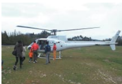
ツインリンクもてぎの眺望を上空約1000mから無料でお楽しみ いただいた「ヘリコプターにのろう!」。