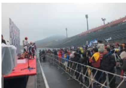
お子さまご同伴のお客さまに各クラスの表彰式を最前列からお楽しみいただいた「表彰式 ファミリーエリア」。