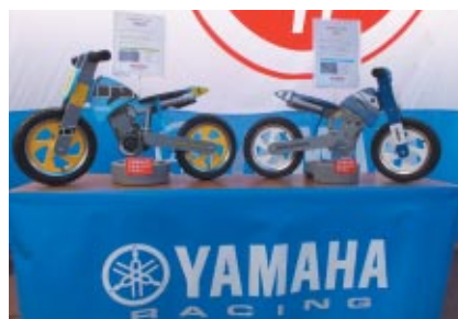
Yamahaブースに展示された同社製品を模したキッズ用バイク。