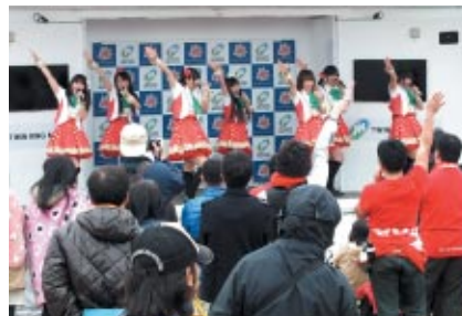
栃木発信で当地アイドル「とちおとめ25」のライブパフォーマンス。