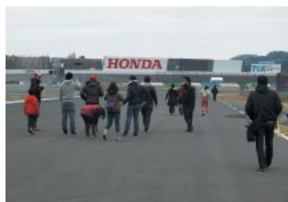
ロードコース(西コース)を開放、無料でお楽しみいただいた「家族みんなでコースウォーク」。