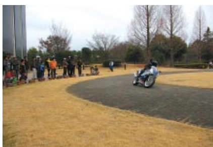
所蔵車両のデモラン「WEEKEND RUN」。 今回は異なる世代のCBRが走行しました。