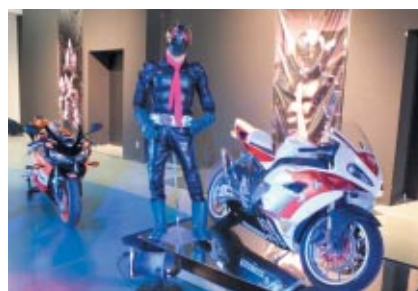
仮面ライダーの立像やバイクとともにそのベース車両のHonda 二輪車を展示した「仮面ライダー×Honda マシンアーカイブス」 (ファンファンラボ)。