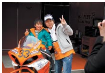
中学生以下のお子さまと同伴者の方に無料でご参加いただいた「コチラレーシングのキッズピットウォーク」。