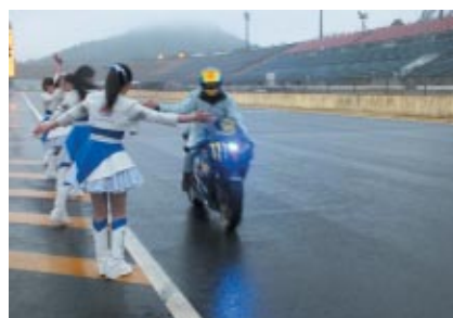
全レース終了後、バイクでご来場のお客さまを対象にロードコースを無料体験走行いただいた「フィナーレパレード」。