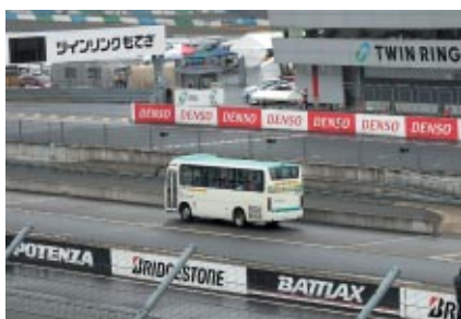
ロードコースに沿って設置されているサービスロードをバスでご体験いただいた「サービスロードバスツアー」。