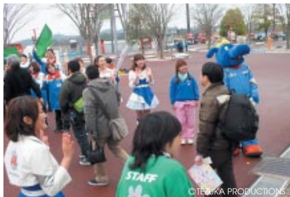
コチラファミリーやツインリンクもてぎエンジェルがお客さまをお出迎えました。

「メガジップラインつばさ」のテイクオフとなった週末。「新生もてぎテイクオフパーティー」と銘打ち中央エントランス周辺特設会場を中心にさまざまなイベントを展開。ツインリンクもてぎの本格的な春がスタートしました。