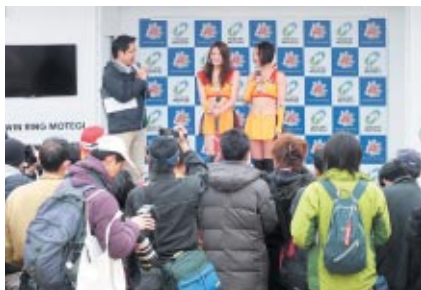
各チームのキャンペーンガールが一堂に会して行われた「キャンギャルオンステージ」。