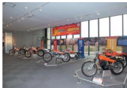
Honda Collection Hallでの特別展示「PROUD of MONTESA～Hondaが引き継いだトライアル王国古豪の誇り～」。 ※5月10日(金)まで