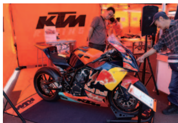
1190 RC8 Rレース仕様車が展示されたKTMブース。