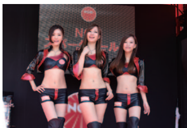
NGKスパークガールズの撮影会が行われたNGKブース。