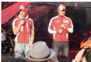
MotoGP™クラスポールポジションを獲得したアンドレア・ドヴィツィオーゾ選手(左)とカル・クラッチロー選手が登場したDUCATIブース。