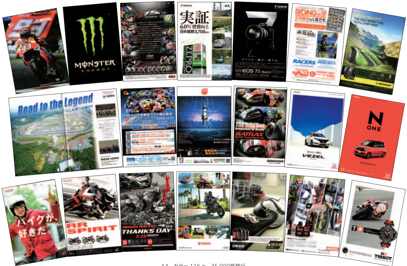
A4 カラー 116 p 35,000部発行