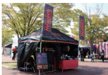
冬季のライディングに威力を発揮するウェア、Heatechブース。