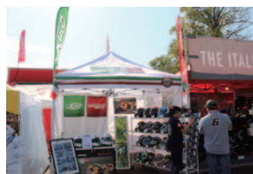
イタリア製ヘルメットNolan(X-lite)の展示・試着が行われたデイトナブース。