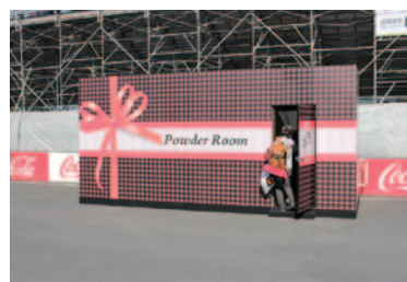
女性専用パウダールームも設置されました。