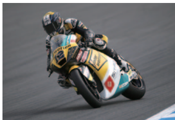
Moto2™クラス 久々の優勝を果たしたトーマス・ルティ