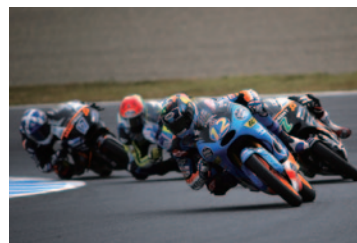
Moto3™クラス 激戦を制して優勝したアレックス・マルケス(先頭)