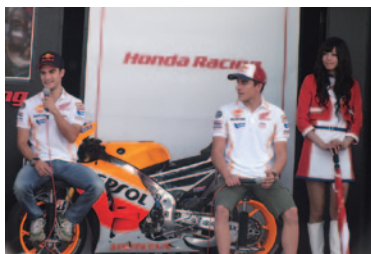
マルク・マルケス選手(右)とダニ・ペドロサ選手が登場してトークショーを行ったHondaブース。

世界最高峰の2輪レースにふさわしく、プロモーションやイベントが展開され、大会をより華やかに彩りました。〈順不同・敬称略〉