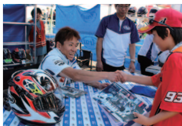
MotoGP™クラスにワイルドカードでスポット参戦した中須賀克行選手のサイン会が行われたアライブース。