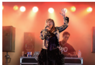
幅広く活躍するアーティストMINMIのライブステージ。