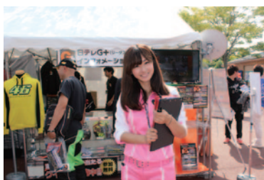
MotoGP™クラス上位3位までを予想、的中させた方に賞品が当たるイベントが実施された日テレG+ブース。