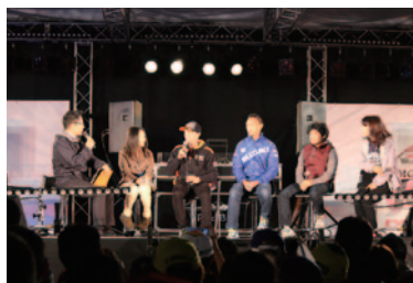
レジェンドライダーや現役ライダーなど豪華ゲストが入れ替わりで出演したトークステージ。写真右2人目より原田哲也氏、青木宣篤選手、アレックス・デアング選手。

11日(土)に行われた恒例の前夜祭。昨年に引き続き「MotoGP™クラブナイト」。中央エントランスMOTOステージを中心に熱く盛り上がりました。