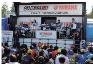
参戦ライダーのサイン入りグッズなどのチャリティオークションが行われたYAMAHAブース。