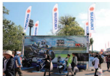
ニューモデルの搭乗体験が行われたSUZUKIブース。2015年からMotoGP™に復活参戦するマシン「GSX-RR」がパネルにあしらわれていました。