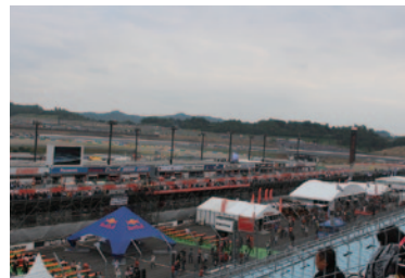
スーパースピードウェイに各メーカーブースやレストスペース、飲食ブースを集中設置。