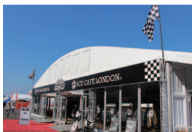
英国を代表する「ACE CAFE LONDON™」とのコラボで期間限定ライダーズカフェが登場。