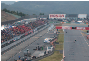
最終コーナーから見たV席(ロードコース左側スタンド)。

今回、ロードコースサイドに設けられたV席(ピクトリースタンド)。マシンの走りを間近に体感いただけるロケーションに加えて、スーパースピードウェイには各メーカーや飲食ブースが立ち並ぶ「ホスピタリティガーデン」を設置、世界最高峰の2輪レースにふさわしい観戦環境をご提供しました。