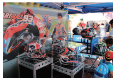
マルク・マルケス選手の年代ごとのヘルメットが展示されたSHOEIブース。