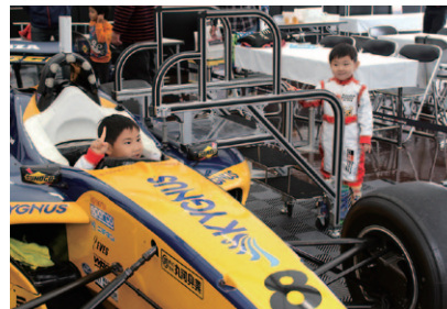
レーシングスーツを着てお子さまに体験いただいたSFマシンコックピット搭乗。