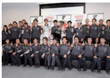
2年連続で年間チームチャンピオンに輝いたP.MU/CERUMO・INGING