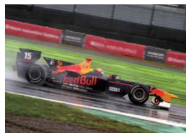
ランキング2位のピエール・ガスリー 公式予選での走り