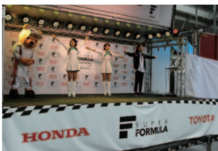
JAF鈴鹿グランプリスペシャルステージのオープニングは、鈴鹿サーキットクイーンがリードしてのラジオ体操。