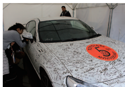
TOYOTA86 5周年を記念してファンの方々のメッセージ、サインを86Kouki!にお書きいただいた「TOYOTA86 5周年記念サインカー展示」。