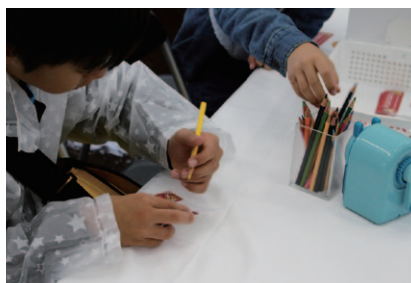
ぬりえをした絵をそのまま世界に一つだけのCanバッジにしてお持ち帰りいただいた「オリジナルCanバッジを作ろう」。