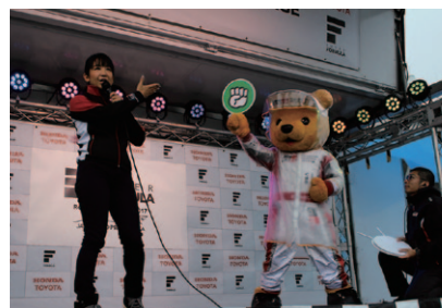
JAF鈴鹿グランプリスペシャルステージで行われた「トヨタくま吉」とのじゃんけん大会。素敵なお物がプレゼントされました。