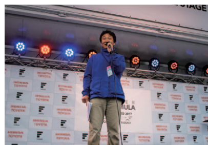
JAF鈴鹿グランプリスペシャルステージで行われた「JAFステージ」。JAF三重支部のスタッフに安全運転のワンポイントアドバイスを語っていただきました。