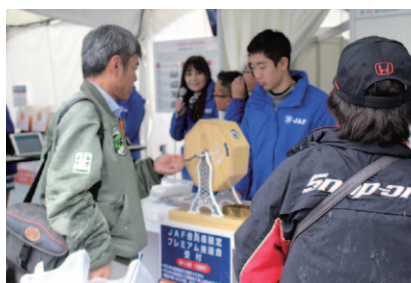
JAF会員の皆さま対象に行われた「プレミアム抽選会」。