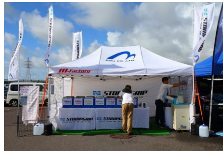
エムファクトリー