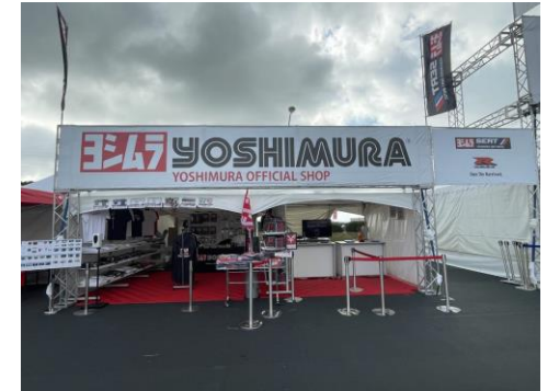
ヨシムラジャパン