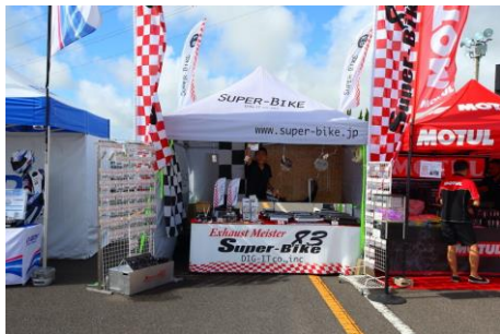
Super-Bike DIG-IT co.,inc.