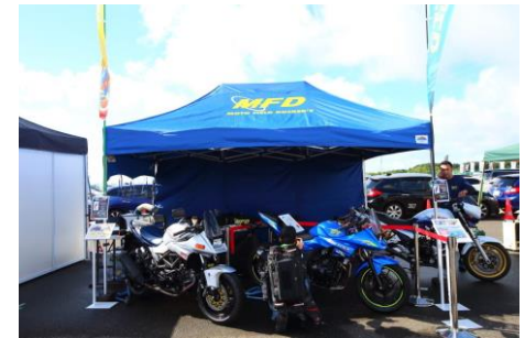
モトフィールドドッカーズ