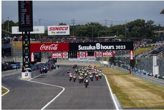
8耐 スタートシーン