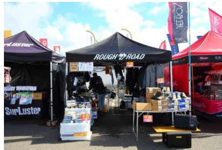
ラフアンドロード