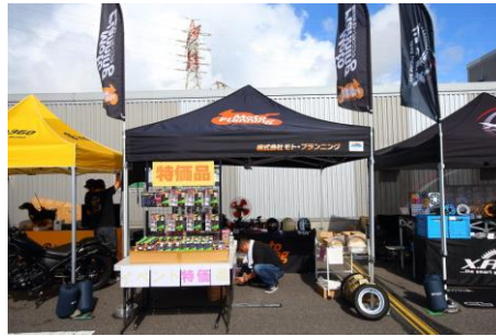
モト・プランニング