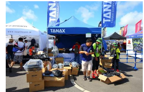
モトフィズ・ナポレオン