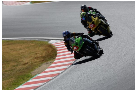
Ninja Team Green Cup