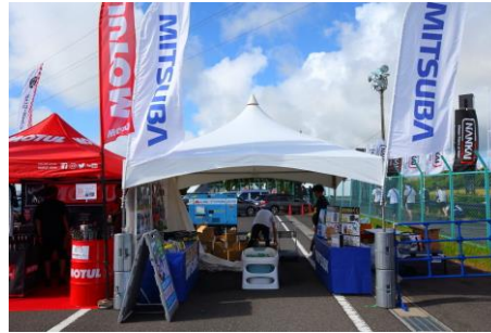
ミツバサンコーワ