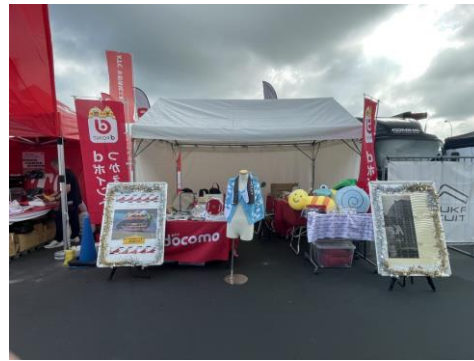
ドコモショップ サーキット通り店