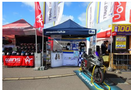
ZERO POINT SHAFT