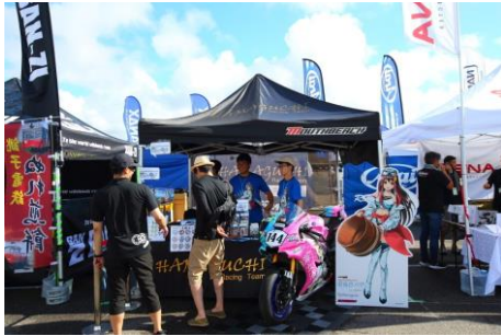
HAMAGUCHI Racing Team