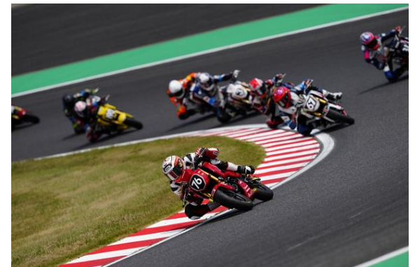
HRC GROM Cup