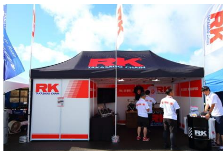
RK TAKASAGO CHAIN