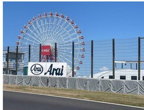
アライヘルメット