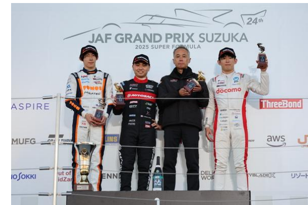
SUPER FORMULA SF Rd12 表彰台