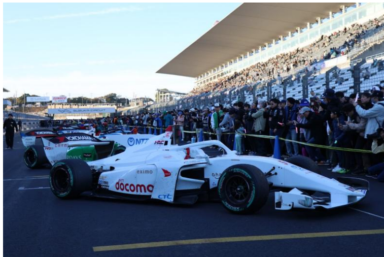
パルクフェルメウォーク