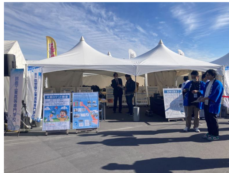
KOSEN 水素ビジョン2025 in 鈴鹿サーキット