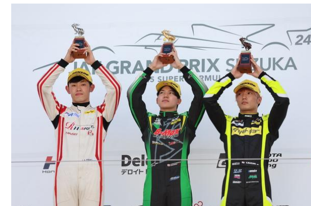
FORMULA REGIONAL Rd15 表彰式