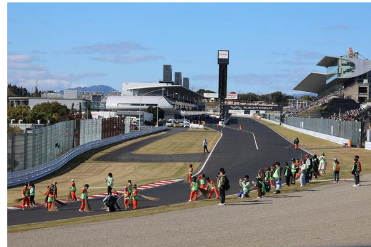
Out of KidZania in SUPER FORMULA