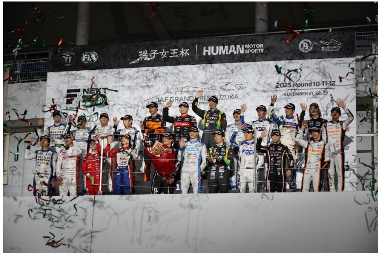
シーズンエンドセレモニー