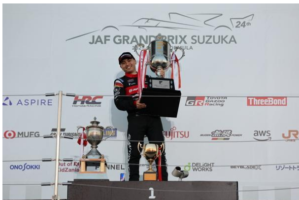
SUPER FORMULA シリーズチャンピオン