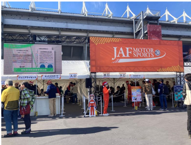
JAFモータースポーツ