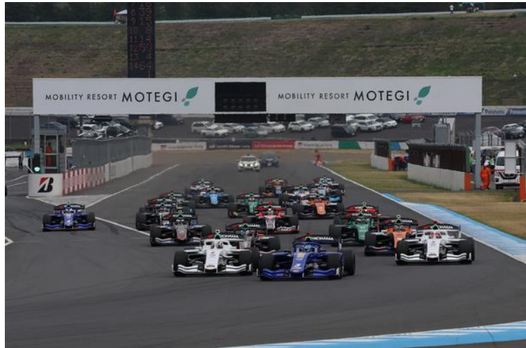
Super Formula Rd4 スタート