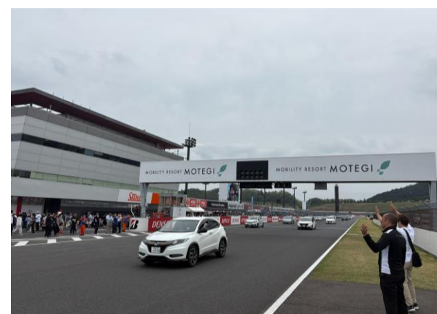
レーシングコース マイカー走行