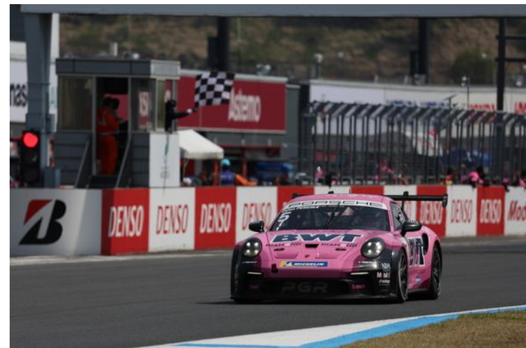
Porsche Carrera Cup Asia Rd3 優勝マシン