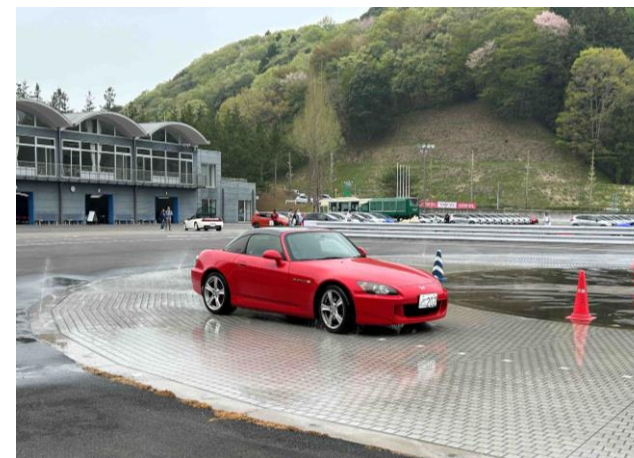
DENSO Presents ドライビングスクール