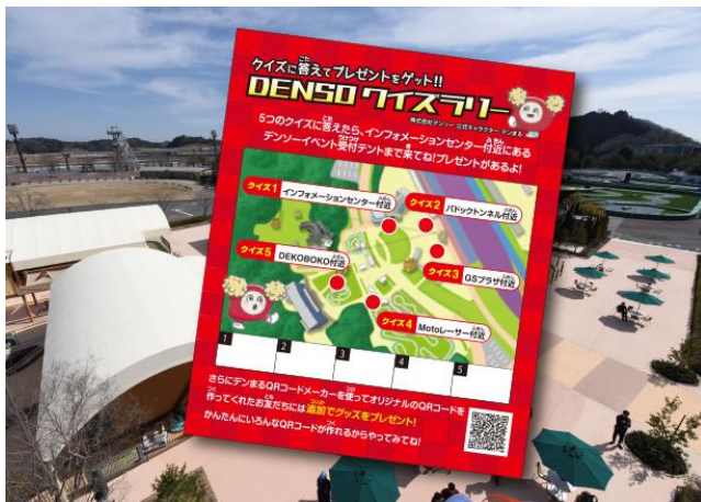
クイズに答えてプレゼントをゲット!! DENSOクイズラリー

株式会社デンソー様とモビリティリゾートもてぎが連動し、レース、乗り物を楽しんでいただく企画を実施