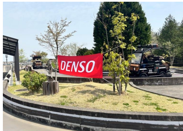
チャレンジしてグッズをGET!! DENSO CUP TRIAL ~DEKOBOKO~