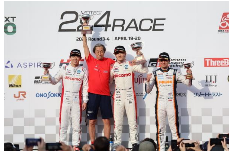
Super Formula Rd3 表彰台