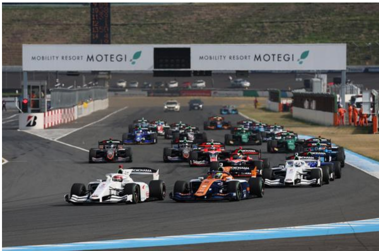
Super Formula Rd3 スタート