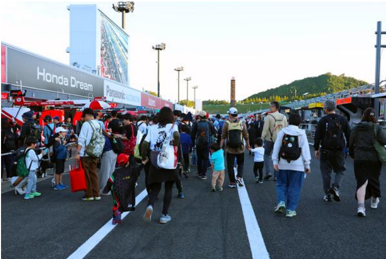
キッズピットウォーク