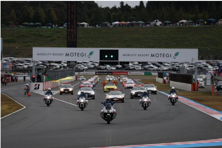
栃木県警 パレードラン