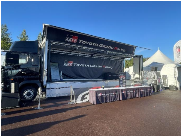
TOYOTA GAZOO Racing