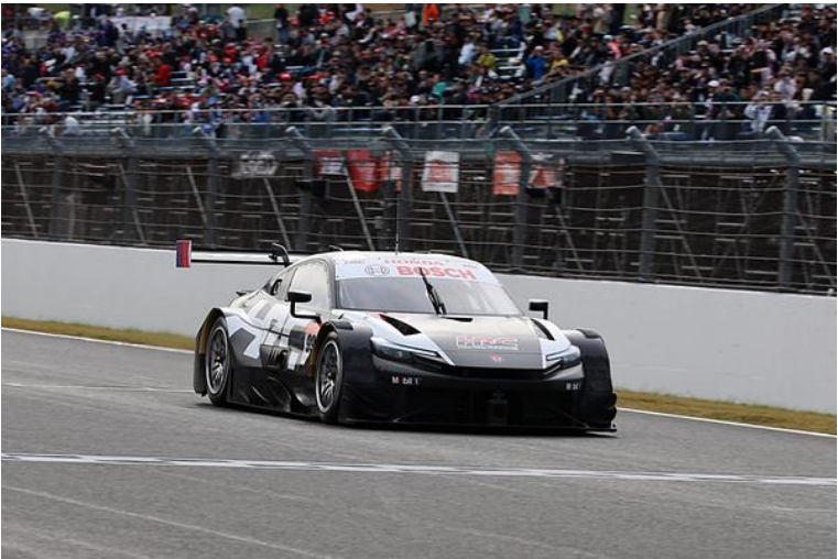
SUPER GT Honda 2026 プロトタイプマシン デモンストレーションラン