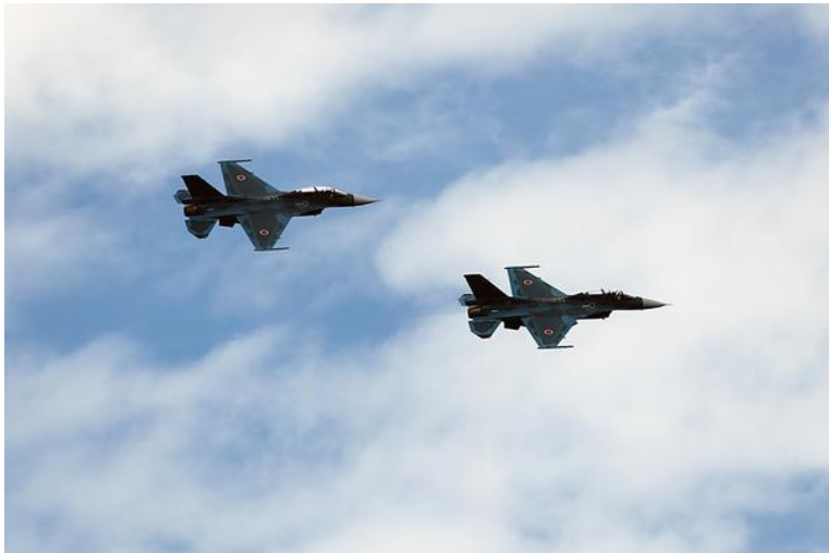
航空自衛隊松島基地「F-2B 戦闘機」歓迎フライト