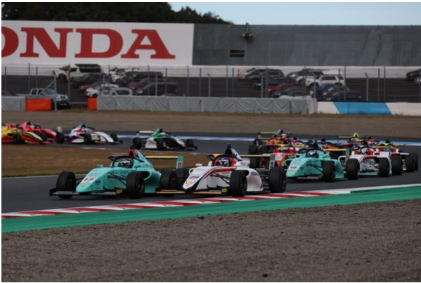
FIFA F4 Rd14