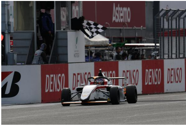
FIFA F4 Rd14