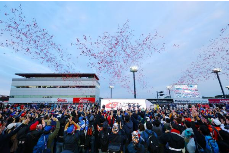
グランドフィナーレ