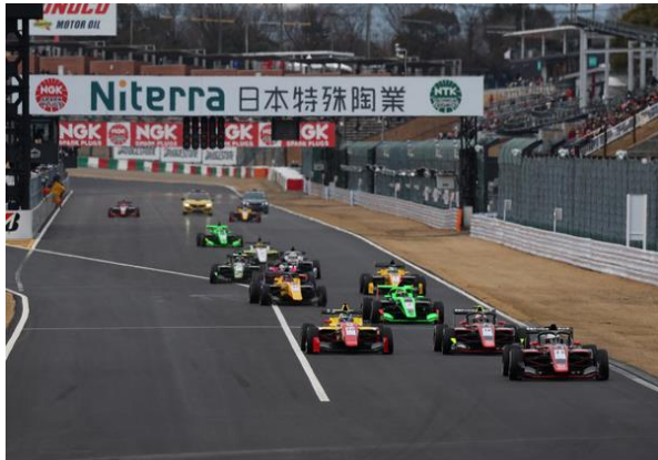
SFL Rd1 スタート