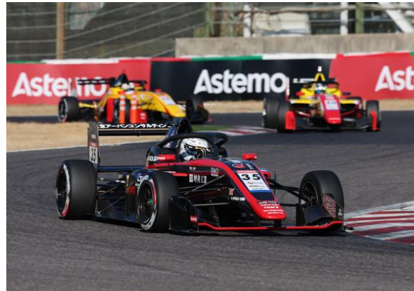
SFL Rd2 優勝マシン