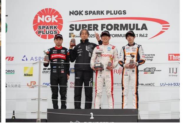
SF Rd1 表彰台