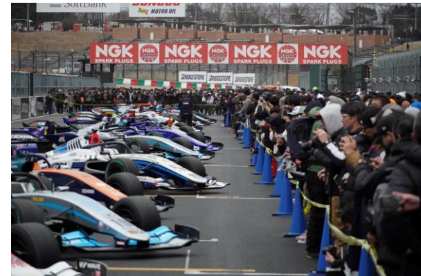
ブリッジ看板（最終コーナー側）