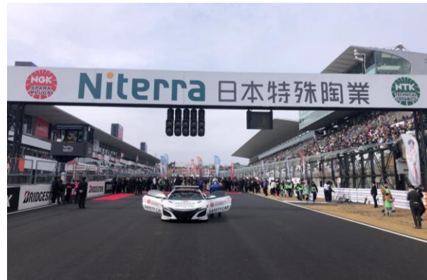
ブリッジ看板（1コーナー側）