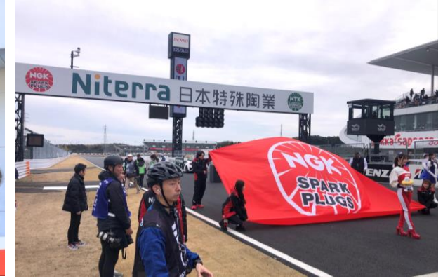
フラッグセレモニー