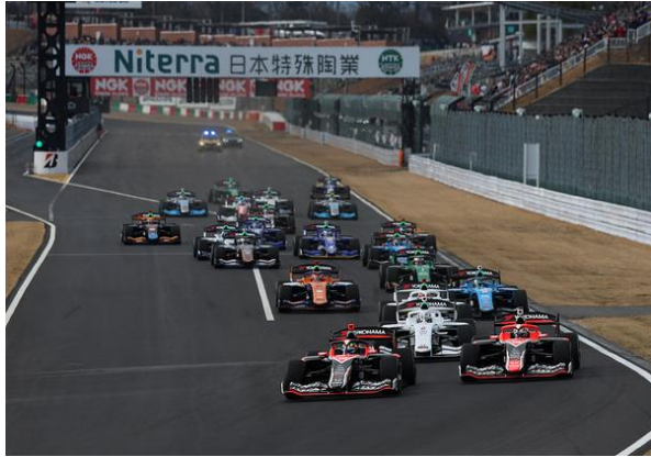
SF Rd1 スタート