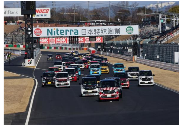
N-ONE OWNER'S CUP スタート