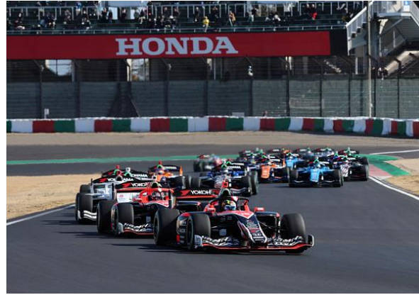
SF Rd2 スタート