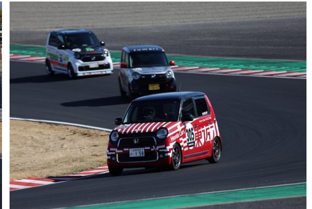
N-ONE OWNER'S CUP 優勝マシン