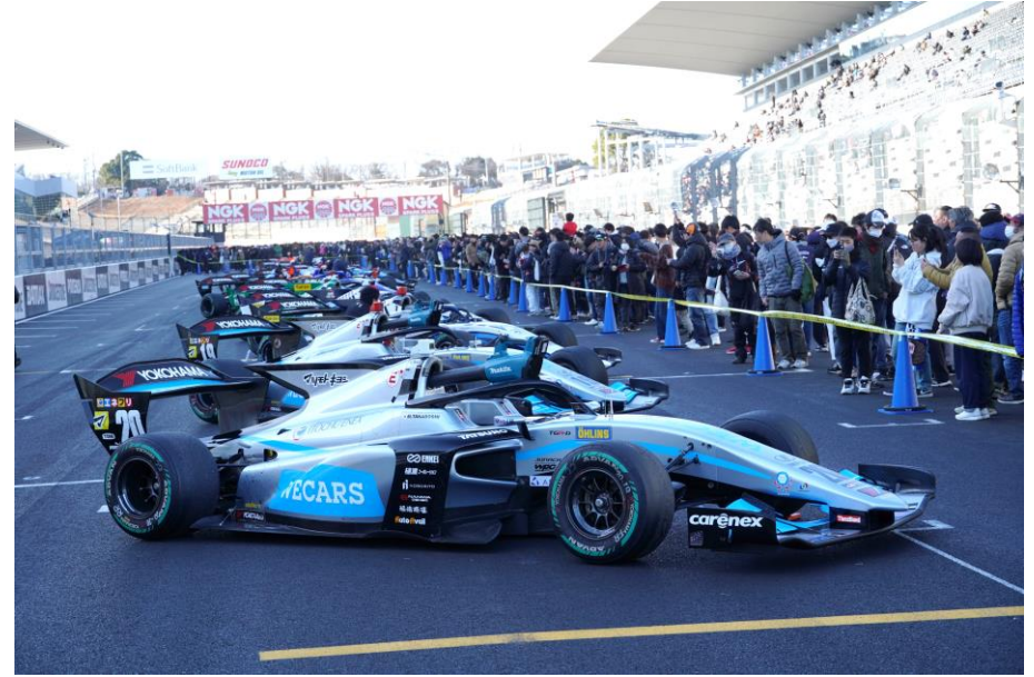
パルクフェルメウォーク