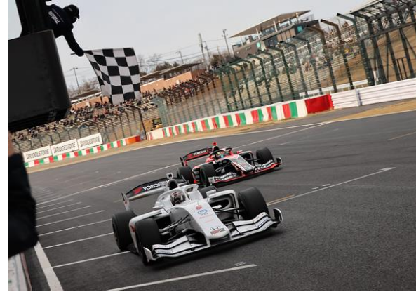
SF Rd1 優勝マシン