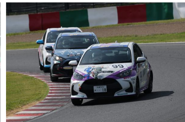
Yaris CUP 優勝マシン