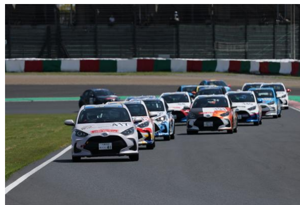
Yaris CUP NOVICE スタート