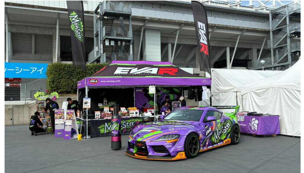
ラナ・エンターテインメント