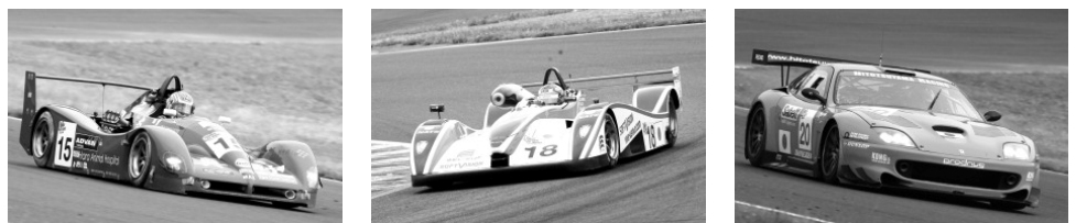
LMP-2クラスのRS(左)とGC21(中)、LMGT-1クラスのフェラーリ550GTSマラネロ(右)

LMP-2クラスは特認を受けた国産スポーツカー、RSとGC21、ともにオープンスポーツカー同士の対決が焦点。LMGT-1クラスでは常勝フェラーリ550GTSマラネロに、新規参入のポルシェボクスターがどう挑むか。そしてLMGT-2クラスには、フェラーリF430GTとポルシェ997GT3RSRが新たに参戦してきた。速さのフェラーリか、信頼性のポルシェか？対照的なお互いの特徴を生かした戦いは予想困難なだけでなく、最後の最後まで予断を許さぬ展開となるに違いない。