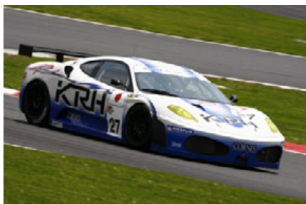
河村隆一監督率いる TEAM KAWAMURAのフェラーリF430GT

LMP1クラスの激闘を頂点に、その後方では毎戦クラスを超えた大バトルが展開されている。第2戦で総合2位に食い込んだのがLMP2クラス、F3マシンをベースに製作されたGC-21をドライブする富澤勝／麻生裕二／黒澤翼組。3位にくい込んだのがLMGT2クラス、河村隆一監督率いるTEAM KAWAMURAのフェラーリF430GTだ。ドライバーは青山光司に、スーパーGTのGT300クラスでトップ争いを展開する新田守男／高木真一。TEAM KAWAMURAは開幕戦でもクラス優勝と大活躍している。そして開幕戦で3位に入った