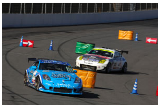
オーバルテストでPanasonicターンを駆け抜けるスーパー耐久マシン

2008年のスーパー耐久シリーズは長い歴史の中に、大きな1ページを刻むことになった。最終戦、第7戦の予選、決勝を11月15日(土曜日)に行い、翌16日(日曜日)にツインリンクもてぎスーパースピードウェイでスペシャルレース、「スーパー耐久オーバルバトル」が開催されることになった。スーパー耐久を戦うBMW・Z4Mクーペ、フェアレディZ、ポルシェ911GT3R、ランサーエボリューション、インプレッサ、RX-7、NSX、シビック、インテグラなどが、