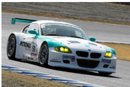
ペトロナスSYNTIUM BMW Z4Mクーペ

スーパー耐久の総合優勝を争うのがエンジン排気量3500cc以上の車両で戦われるSTクラス1。昨年はフェアレディZの影山正美／青木孝行組が5勝を記録してチャンピオンを獲得したが、今年は状況が一変。昨年デビューしたBMW Z4Mクーペは柳田真孝／F・ハイルマン組に加え、片岡龍也／谷口信輝組(ともにペトロナスSYNTIUM)が参戦。2台体制になるといきなり本来のパワーを見せつけ、