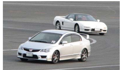
※写真は2009年開催時の様子