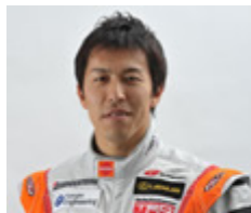
LEXUS TEAM LeMans ENEOS