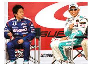
過去のドライバートークショーの様子

話題のGTドライバーがステージに登場！最終戦前だけに貴重な情報を聴くことができるかも！？