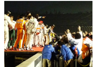
2009年のグランドフィナーレの様子

表彰式に続いて、シリーズ最終戦のみおこなわれるグランドフィナーレ。激動の1年を戦ってきたGT500とGT300の全ドライバーが集結！各メーカーを代表するドライバーへのインタビューや、サプライズも！？