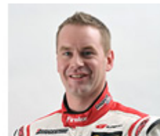
LEXUS TEAM ZENT CERUMO