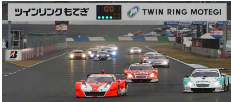
2009年のスタートシーン