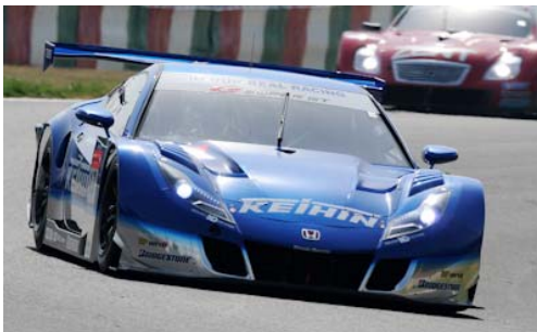
Honda HSV-010 (KEIHIN HSV-010)