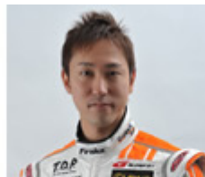
LEXUS TEAM KRAFT