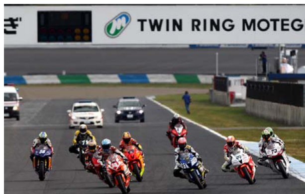
2010 MFJ 全日本ロードレース選手権シリーズ 第6戦 J-GP2スタートシーン

2年目のシーズンとなり、ディフェンディングチャンピオン不在の今シーズンを制し世界への扉を開くライダーは現れるか、注目だ。