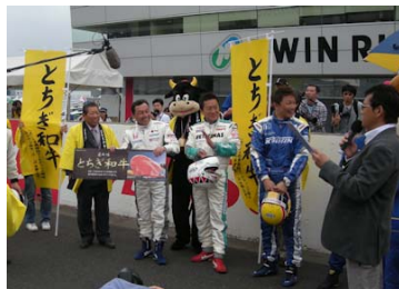
過去のドリームマッチ 表彰式の様子

チーム監督や名ドライバーによるミニレース、「とちぎ和牛カップ」マスターズ・オブ・フォーミュラを8月7日(日)決勝日に開催いたします。優勝者にはJAとちぎより「とちぎ和牛」をプレゼント。海外で、国内で、激しい戦いを繰り広げてきたドライバーたちは、当時にタイムスリップした熱い走りで、なつかしの名勝負を見せてくれるだろう。