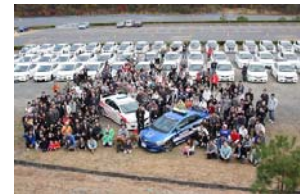
過去のオフ会の様子

シビックワンメイクレース・ラストイヤーを記念し、歴代のシビックオーナーを一堂に集めたオフ会を実施。デモカー展示やオーナーズパレードなど、様々なイベントを実施します。