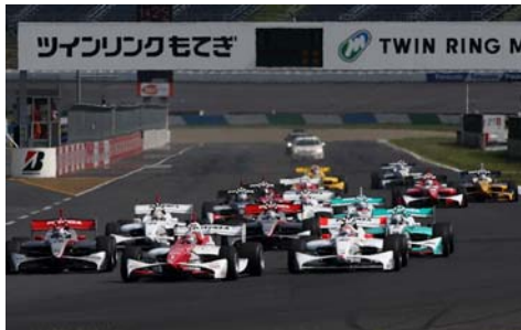
2010年フォーミュラ・ニッポン第4戦スタートシーン