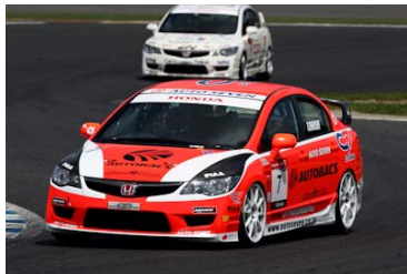
ツインリンクもてぎを走るシビック

「全員が同じマシンで、己の腕を競い合う」のがワンメイクレース。日本で最も有名で伝統があるのがホンダ エキサイティングカップ ワンメイクレース～シビック・シリーズ～だ。そのインターシリーズ第3戦と東日本シリーズ第2戦が混走で行われる。マシンによる差がつきにくく、毎回手に汗握る大接近戦でのバトルが展開されるが、特にこのツインリンクもてぎではストップ＆ゴータイプのコースレイアウトになっているため、各所にオーバーテイクポイントが存在し、激しい順位争い、ライバルとの駆け引きが見どころとなってくる。フォーミュラカー以上に激しい接近戦バトルは必見だ。