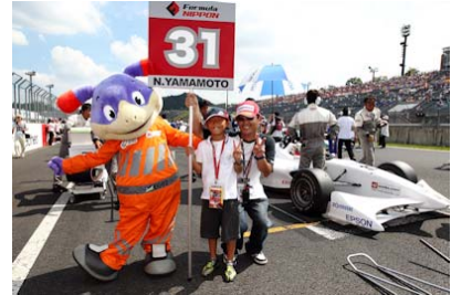
2010年フォーミュラ・ニッポン第5戦でのグリッドボードキッズの様子