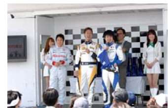
過去のチャリティーオークションの様子