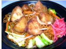
じゃがじゃが焼そば