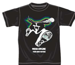
メガジップライン つばさTシャツ ■販売: 3月30日(土)～ ■料金: 2,500円

パッケージは、うまい棒のキャラクターが 「メガジップライン つばさ」に乗っているイラストが入っており、 ツインリンクもてぎの限定販売となります。 メガサイズ(40本入り)ですので、お土産にもオススメです。