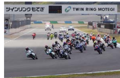
2012 MOTEGI 2&4レース J-GP3スタートシーン