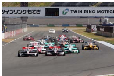
2012年MOTEGI 2&4レース フォーミュラ・ニッポンスタートシーン