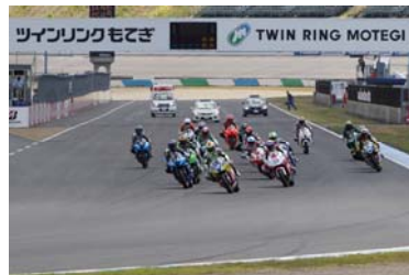
2012 MOTEGI 2&4レース J-GP2スタートシーン