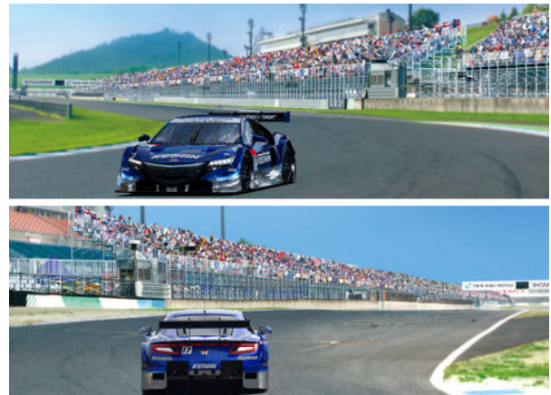
「ビクトリースタンド」イメージ