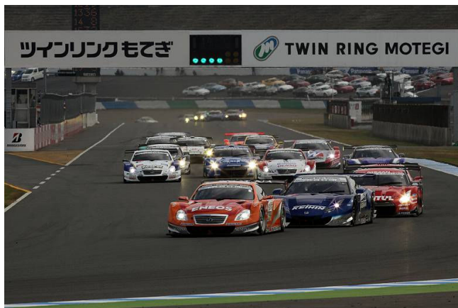
2013 もてぎGT250kmレース スタートシーン