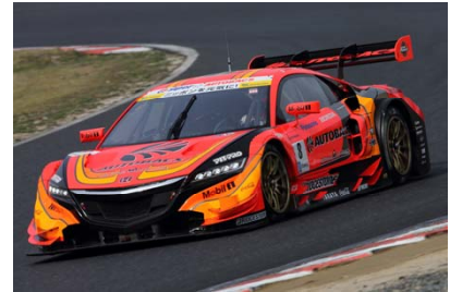
NSX CONCEPT-GT勢最上位の ARTA NSX CONCEPT-GT