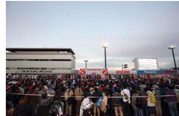
2015年のグランドフィナーレの様子

2016年SUPER GTシリーズを締めくくるフィナーレセレモニーを開催いたします。GT500クラス、GT300クラスのドライバーが登場し、1年間支えていただいたファンの皆様と共に2016年を振り返り、ファンの皆様とふれ合いながらフィナーレセレモニーを行います。ドライバーやチームの雄姿を見られる最後の瞬間にぜひお立ち会いください。