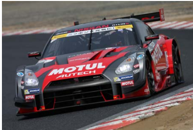
開幕2連勝を飾った MOTUL AUTECH GT-R

の戦いとなる。難しいとされる2連勝も十分可能となり、SUPER GT公式戦初となる2日間連続決勝の最終戦は、年間チャンピオンをかけた激しい戦いが期待される。