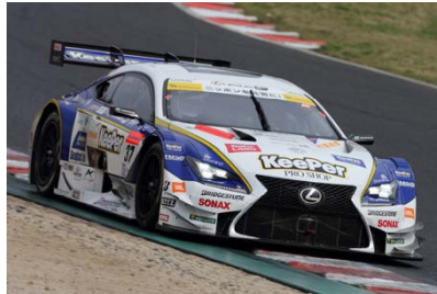
ランキング2位の KeePer TOM'S RC F