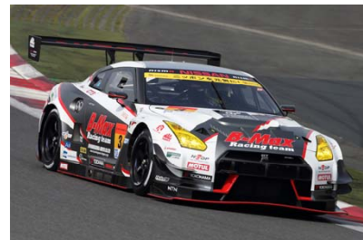
第2戦で優勝した B-MAX NDDP GT-R