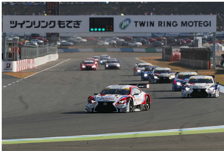
2016年第8戦のスタートシーン

本レースの前売チケットは9月9日(土)より販売いたします。なお、V席、パドックパス、ピットウォークパスなどの一部のチケットは、9月4日(月)より先行販売いたします。