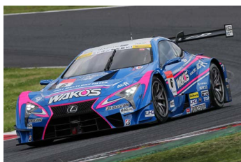
ランキングトップの WAKO'S 4CR LC500

2017年のSUPER GTシリーズ、GT500クラスは車両規定の変更に伴い各メーカーはニューマシンを投入。その対決が注目された開幕戦は、予選こそHonda勢のARTA NSX-GT(野尻智紀/小林崇志組)がポールポジションを獲得したが、決勝はLEXUS勢が強く、KeePer TOM'S LC500(平川亮/ニック・キャシディ組)を筆頭に6位までを独占する結果となった。LEXUS勢の強さはその後も続き、第2戦からZENT CERUMO LC500(立川祐路/石浦宏明組)、au TOM'S LC500(中嶋一貴/ジェームス・ロシター組)、DENSO KOBELCO SARD LC500(平手晃平/ヘイキ・コバライネン組)と、前半の4戦全てでLEXUS勢が優勝を飾っている。ただし、ライバルも黙っていない。第3戦でKEIHIN NSX-GT(塚越広大/小暮卓史組)、RAYBRIG NSX-GT(山本尚貴/伊沢拓也組)が2位、3位表彰台を獲得すると、第4戦は再びARTA NSX-GTがポールポジションを獲得したのを始め、予選トップ3をHonda勢が占めた。さらに決勝ではNISSAN勢のS Road CRAFTSPORTS GT-R(本山哲/千代勝正組)が2位に食い込み、後半戦は形勢逆転かと思わせる1戦となった。第4戦終了時点でシリーズランキング上位はLEXUS勢が占めるものの、NISSAN勢、Honda勢がじわりとその差を詰めてきた。今年も最終戦ツインリンクもてぎは、3メーカーが入り乱れてのタイトル決定の舞台となりそうだ。