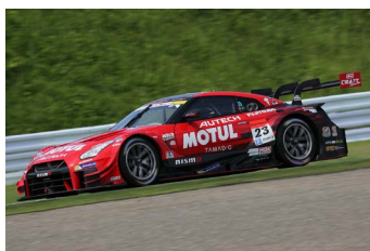
NISSAN勢最上位の MOTUL AUTECH GT-R