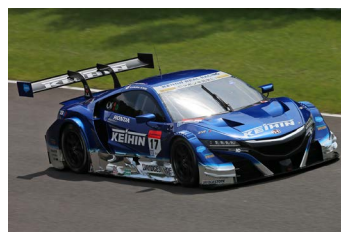
Honda勢最上位の KEIHIN NSX-GT