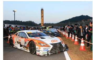
2016年のパークフェルメウォークの様子