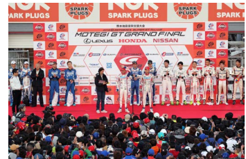
2016年のグランドフィナーレの様子