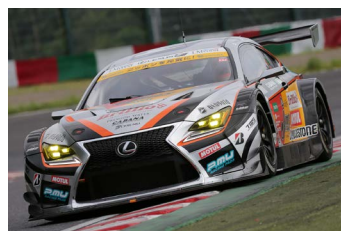
第2戦で優勝した中山/坪井組 JMS P.MU LMcorsa RC F GT3