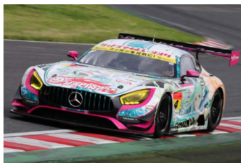
開幕戦で優勝した谷口/片岡組 グッドスマイル 初音ミク AMG