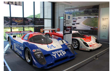
過去の特別展示の様子(1990年代展示)