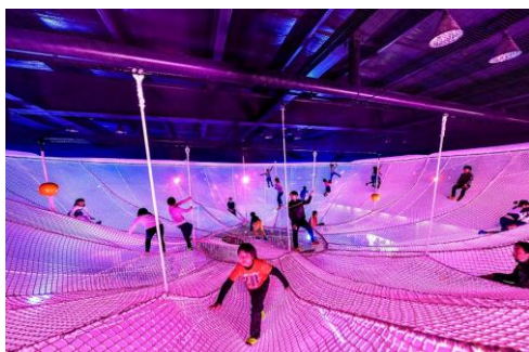
柔らかい葉をイメージしたネット