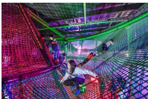
アクティブに動ける強く張られたネット

針葉樹をモチーフとした高さ約6mのツリーは、そのイメージの通り緑のネットで作られています。また、広葉樹のネットとは異なり、ネットの張りが強くなっているため、よりアクティブに動き回ることができます。