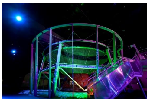
針葉樹をイメージした緑のツリー