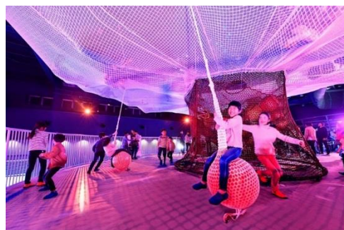
木の実をイメージしたブランコ