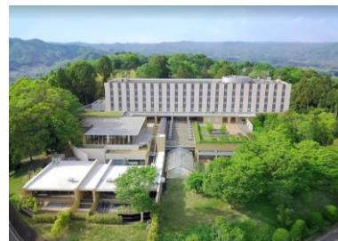
ホテルツインリンク (外観)