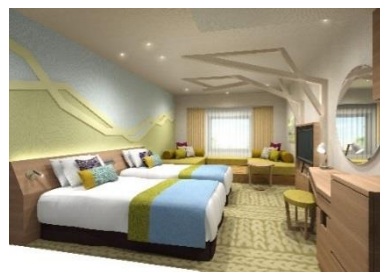
スーペリアファミリールーム (イメージ)