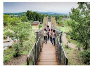
森散策や自然体験ができる 「ハローウッズの森」