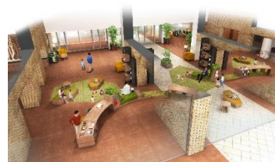
森を表現した新たな装いのロビーラウンジ (イメージ)

広々としたロビーは、木の葉をモチーフにしたソファや緑を基調としたカーペット、木目が美しいカウンターを新たに配置し、自然を感じながらリラックスできるブックカフェスペースへと生まれ変わります。