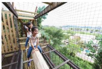
どんぐりの木をモデルにした 「森感覚アスレチック DOKIDOKI」