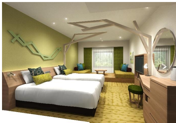
森をテーマにした「スーペリアファミリールーム」 (イメージ)

ツインリンクもてぎには、気軽に自然体験や森散策ができるフィールドがあり、また、ジップラインや立体迷路、アスレチックなど親子で挑戦できるアトラクションが充実し、自然豊かな森を1日中楽しむことができる施設となりました。都会では味わえないアクティビティで思いっきり遊んだ後も、ホテルツインリンクのくつろぎの空間で森の余韻を感じながらごゆっくりお楽しみいただけます。