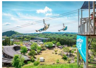
森とサーキットを結ぶジップライン 「メガジップライン つばさ」