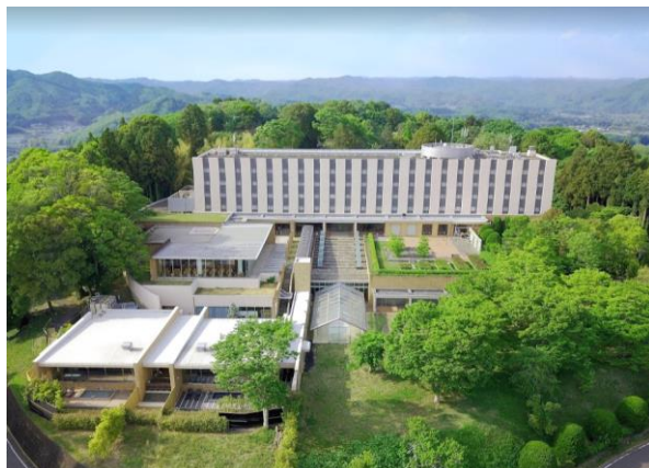
豊かな自然に囲まれたホテルツインリンク (外観)