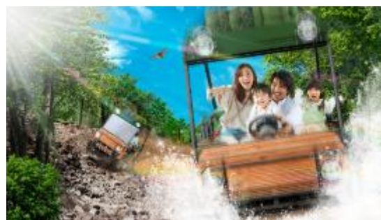
「オフロードアドベンチャー DEKOBOKO（デコボコ）」