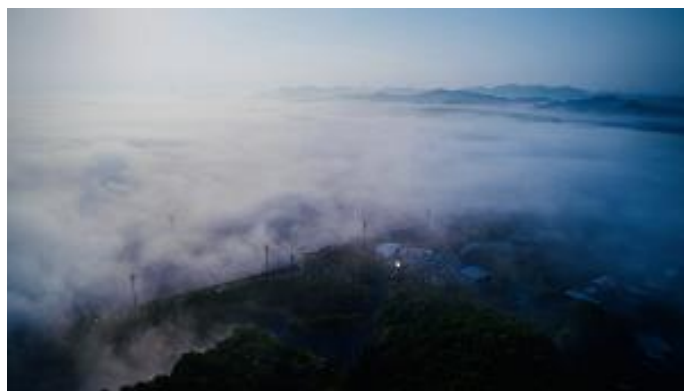
もてぎの森に広がる雲海