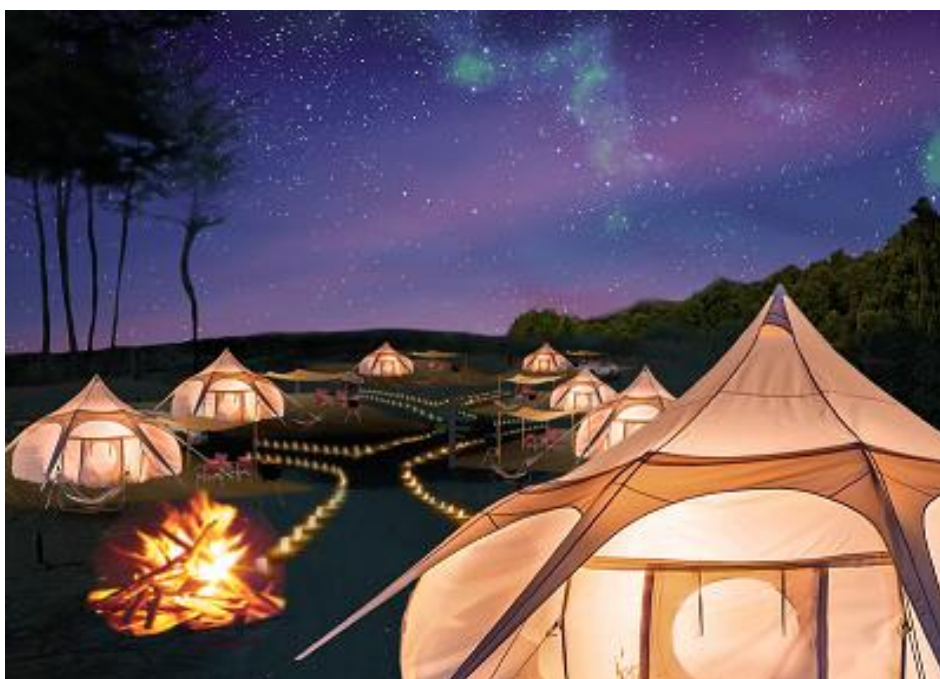
森と星空のキャンプヴィレッジ 新グランピングエリアのイメージビジュアル

2016年のオープン以来、高い評価をいただいている既存グランピング15サイトに加え、13サイトの新エリア誕生により、多くのお客様がグランピングという入口をきっかけに、「森の冒険アクティビティ」という新たな扉を開いていただけることでしょう。