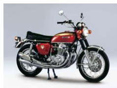
ドリーム CB750FOUR (1969年)