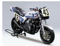
CB750F レーサー (1982年) M.ポールドウィンデイトナ100