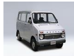
ライフ ステップバン (1972年)