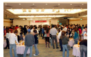
写真は昨年のシーズンエンドパーティーの様子

※詳細、参加申し込みなどについては、後日鈴鹿サーキットホームページにて発表されます。