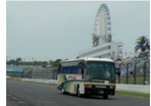
パドックバスをお持ちのお客様は無料でバスツアーに参加いただけます ※写真はイメージです