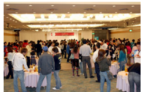
昨年のシーズンエンドパーティーの様子

※先着150名様までの受付となります。 ※3歳未満の方は有料保護者の方の同伴が必要になります。 鈴鹿サーキットホームページよりお申し込みください。