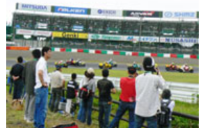
第2コーナーイン側の激感エリアの様子

レースの迫力をより間近に感じていただけ、ゆったりとより快適にご観戦いただけるのが、ピット上のホスピタリティーブース。ピットの様子をまさに真下にご覧いただけます。大屋根の下でゆったりとモニター観戦できるのもホスピタリティーブースの魅力です。