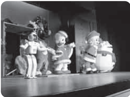
ASIMOも加わったスペシャルなショーで楽しんでね。