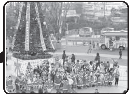
サンタキッズとコチラファミリーの記念撮影の様子。