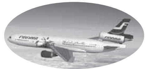
協力/フィンランド航空