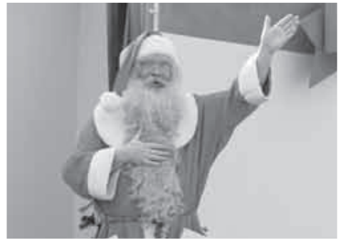
遠く海を越え、フィンランドからサンタさんが鈴鹿に!