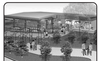
でんでんむし ステーション