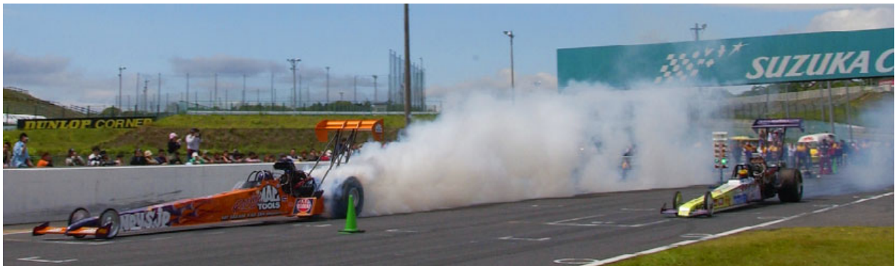
トップフューエル ドラッグスターのスタートシーン

雨天の場合は競技内容の変更またはエキシビションレースとして開催する場合があります。