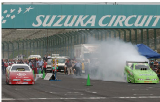
ファニーカーのスタートシーン

50年以上も前にアメリカ・カリフォルニアで生まれたドラッグレース、2台のマシンが左右に並んで、シグナルの合図とともに猛ダッシュ。ゴールラインを速く駆け抜けたほうが勝ち! というシンプルなものだが、その迫力たるや他に類を見ないほど。日本ではまずお目にかかれない巨大なV型8気筒エンジンを搭載したマシンが、ものすごいエンジン音を残して猛ダッシュ。わずか5秒あまりでそのスピードは時速500km近くに!?達してしまうほどで、「地上最速のレース」とも呼ばれているのだ。