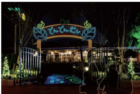
でんでんむしのりばの入口では、かわいい光のでんでんむしがお出迎え。