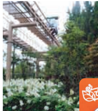
でんでんむしのレールの下の「あじさい畑」を散策しながらウォーキング！