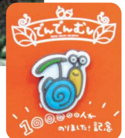
でんでん10万人突破記念ピンバッジ。