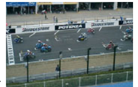
V席から見たグリッドの様子

V指定席の最上部に位置する屋根付きの観戦スペースVIPテラス。レースの迫力や音が生で伝わり、レースの臨場感をお楽しみいただけます。