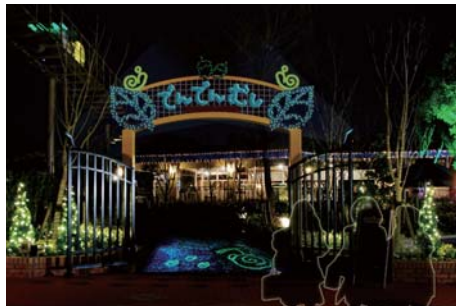
でんでんむしのりばの入口では、かわいい光のでんでんむしがお出迎え。