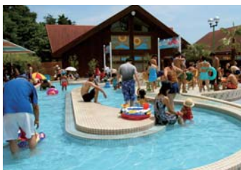
キッズ流水プール