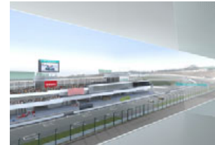
パノラマルームからの眺め ※イラストはイメージです