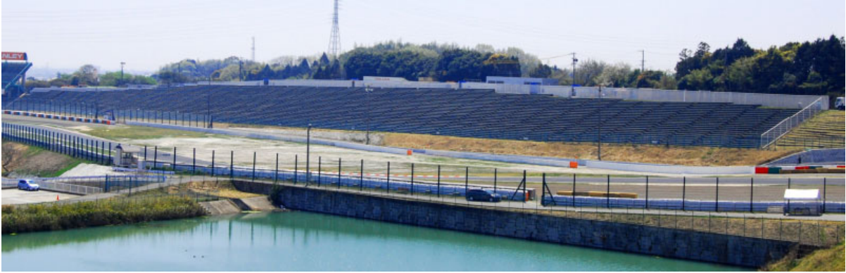
C席全景。上半分が中嶋一貴応援席が設けられるC2席