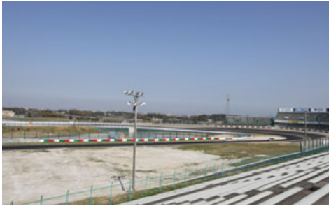
C2席から第1・第2コーナーを望む

C席の上段部分となるC2席は第1コーナーの飛び込みからS字までを見渡すことができます。迫力満点の第1コーナーへの飛び込みシーンに加え、第2コーナーからS字までの走りからはマシンの仕上がり具合やドライバーのテクニックの差を観察することができます。またフル加速時の華麗なエンジンサウンドもC2席の魅力です。