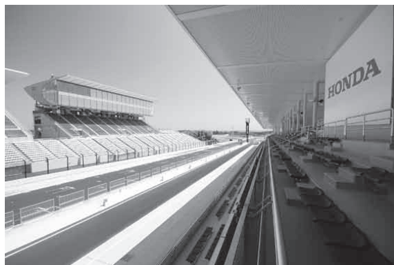
ホスピタリティテラスからの眺め。