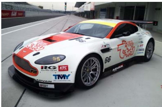
アストンマーティン

多彩な車種が参戦し、毎年タイトル争いが僅差のまま最終戦までもつれ込むのがGT300クラス。昨年、一昨年とニッサンZ、ガライヤ、ポルシェ911GT3、フェラーリ、紫電、RX-7、ランボルギーニなどがトップ争いを展開したが、今年はそこに新たなチャレンジャーが登場した。アストンマーティンだ。