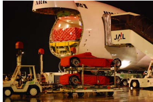
2009年のカーゴ便到着の様子

合計5機のジャンボジェットカーゴ便に、合計約500トンにも及ぶF1マシン、タイヤ、チーム機材、その他F1レース運営に必要な全ての機材が積み込まれ、セントレア空港(中部国際空港)に到着予定です。この様子はUSTREAMによるライブ配信を予定しています。