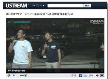
ポッカGTサマースペシャル前夜祭 USTREAM配信のひとつ