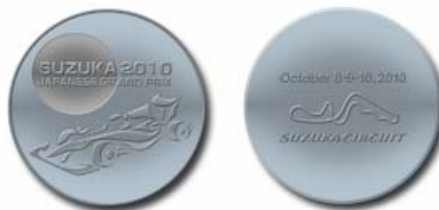
JAPANESE GRAND PRIX SUZUKA 2010 ロゴデザインメダル