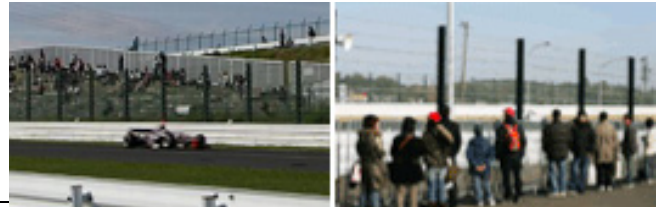
※写真は激感エリアのイメージです