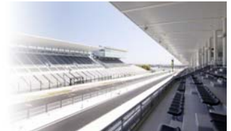
ホスピタリティテラス