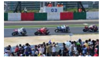
過去の激感エリアの様子