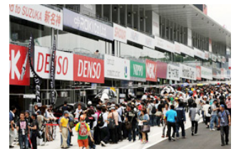
過去のピットウォークの様子