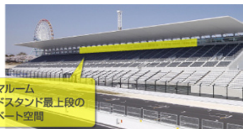
パノラマルーム グランドスタンド最上段の プライベート空間

パノラマルームはグランドスタンド最上段のプライベート空間。冷暖房完備の個室で、周囲を気にせずゆったりとご観戦いただけます。サーキットビジョンを見ながらの観戦やコースを廻る観戦のベースキャンプにも、またお子様連れのご家族にもおすすめです。