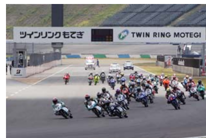
J-GP3スタートシーン(もてぎ2&4レース)