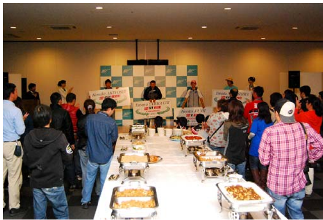
2011年のシーズンエンドパーティーの様子

10月28日(日)最終戦レース終了後、ピットビル2階ホスピタリティラウンジにてシーズンエンドパーティーを開催いたします。パーティーには激闘の1年を走りきったライダーも参加。ライダー達がファンの皆様のテーブルに赴き、サインや歓談を行う交流タイムもご用意。またライダーのサイン入りプレミアムグッズが当たる大抽選会をはじめ、シリーズ表彰なども実施いたします。2012年の締めくくりとなる、ファン交流シーズンエンドパーティーに、ぜひご参加ください。