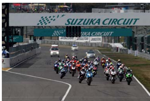
2012鈴鹿2&4レース、JSB1000スタートシーン