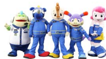
鈴鹿サーキットのキャラクター “コチラレーシング”