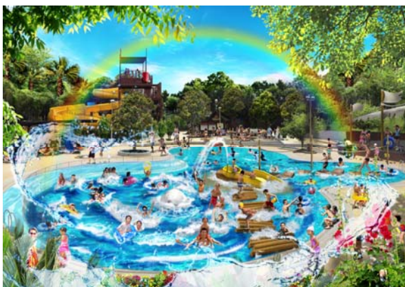
アドベンチャーウェーブ全景 ※イラストはイメージです