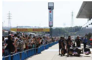
2012年のピットウォークの様子

さらに、「パドックパス」や「VIP用ピットウォーク」への参加権利が当たる抽選も開催。今年も木曜日からF1日本グランプリを是非お楽しみください。