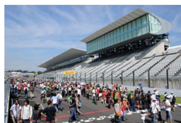
2012年のメインストリートウォークの様子