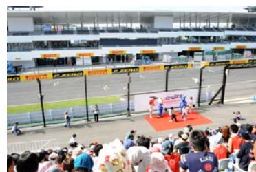
2012年のトークショーの様子