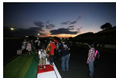
2012年の西コースウォークの様子