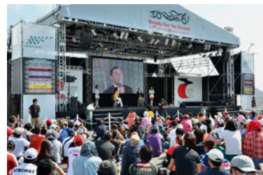
2012年のトークショーの様子

鈴鹿サーキットF1日本グランプリ25回目の開催を記念し、日本人初のF1フル参戦ドライバーであり、第1回大会(1987年)に参戦した中嶋悟氏、また息子の現役レーシングドライバー、中嶋一貴選手、中嶋大祐選手の親子揃ってのトークショーを開催いたします。