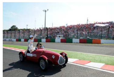
2012年のドライバーズパレードの様子