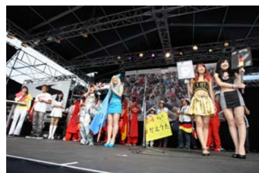
2012年のサポーターズコンテストの様子

パドッククラブのチケットを目指して、毎年盛り上がる「F1サポーターズコンテスト」を今年も開催いたします。今年では会場のお客様もゲスト審査員とともに審査をしていただきます。コスプレに限らず、アツい応援メッセージを発表したり、友達同士やご家族でのエントリーも可能です。