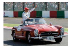
2012年のドライバーズに参加したクラシックカー(一部)