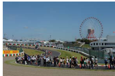
2012年の東コース開放の様子