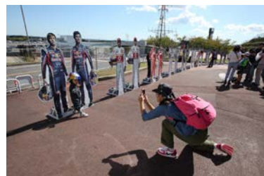
過去のドライバー等身大パネルの様子