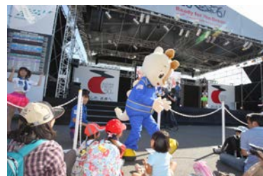
2012年のキッズステージの様子

鈴鹿F1日本グランプリ25回目の開催を記念し、過去の歴史を振り返る企画としてクイズ大会を開催。10月11日金曜日から10月12日土曜日に掛けて予備予選・予選を行い、10月13日日曜日には決勝進出の4名に加え、ジャーナリストの小倉茂徳氏が参加し、チャンピオン決定戦を実施。優勝者には、チャンピオンベルトとパドックパスをプレゼントいたします。