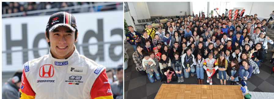
佐藤琢磨選手と、2013鈴鹿2&4レース 佐藤琢磨ファンラウンジの様子