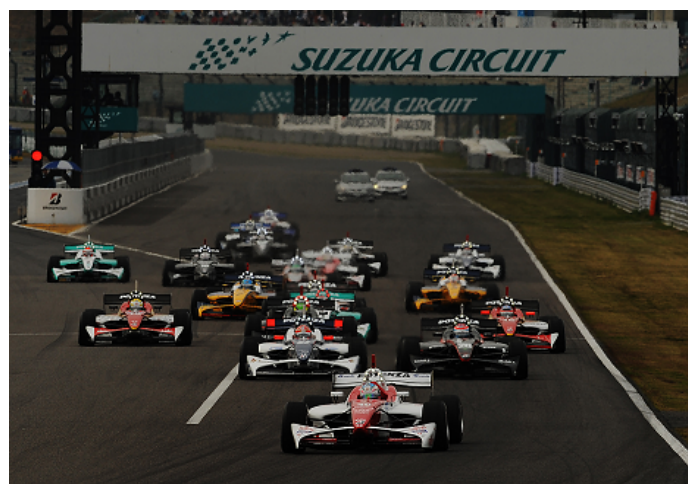
2013鈴鹿2&4レース スーパーフォーミュラ スタートシーン

観戦チケット、プレミアムエリアパス、佐藤琢磨ファンラウンジの詳細は次ページ以降をご確認ください。