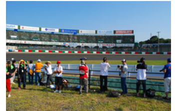
激感エリアイメージ