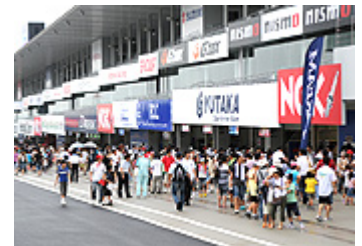
ピットウォークイメージ

※小学生以下のお子さまは、無料でご参加いただけます。 ※前売りピットウォーク券完売の場合、当日ピットウォークは販売いたしません。 ※ピットウォーク時の脚立の持ち込みはご遠慮ください。