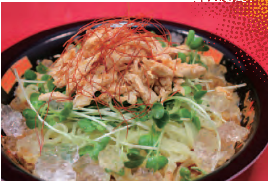
③冷し四川担々麺 (店:四川担担麺)