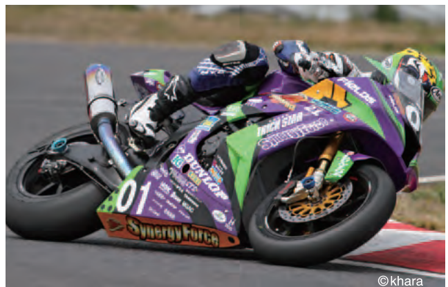
2013年鈴鹿8耐 エヴァRT初号機 シナジーフォースTRICK STAR ©khara