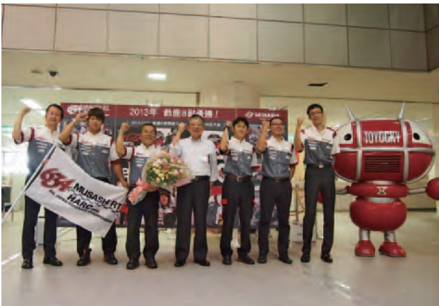
ハルク・プロの豊橋市優勝報告の様子 (2013年8月29日)