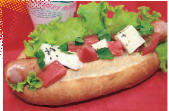
④地元トマトのカプレーゼドッグ (店:ホットドッグファクトリー)