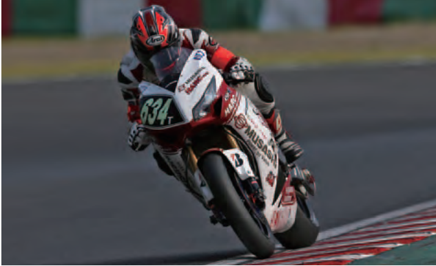
2013年鈴鹿8耐 MuSASHi RT HARC-PRO.