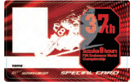
8耐スペシャルカード(顔写真入り) ※デザインは変更する場合がございます。

※スペシャルカード特典の対象は、小学生までのお子様と、その同伴者となります(大人の方だけのスペシャルカード特典は受けられません)。