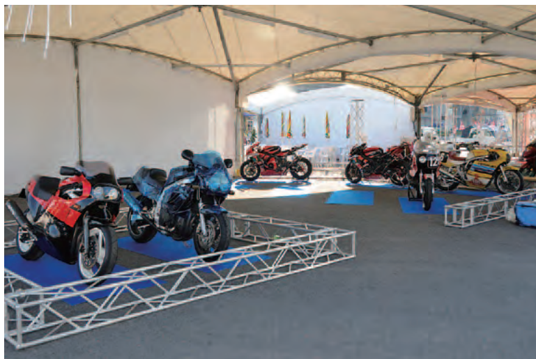
※展示車両はイメージです。