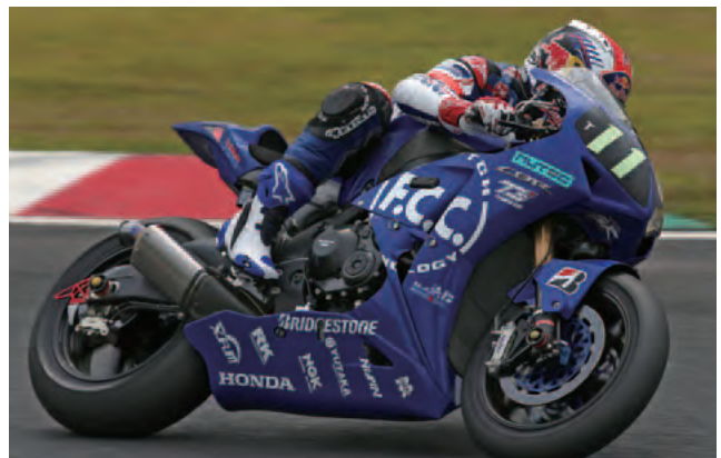
2013年鈴鹿8耐 F.C.C. TSR Honda