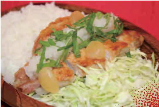
①おろし白醤油とんてきプレート (店:鈴鹿とんてき本舗)

8耐に参戦する人気チームのおすすめするメニューがグランドスタンド売店に登場! 四日市トンテキや伊勢うどんなどの人気店とのコラボレーションで8耐を熱く盛り上げます。