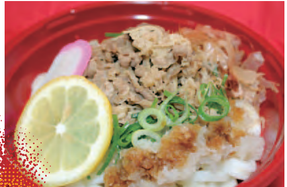
②冷し肉おろし伊勢うどん (店:伊勢うどん)