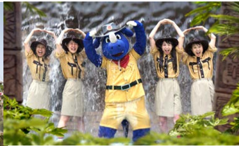
びしょぬれイベント