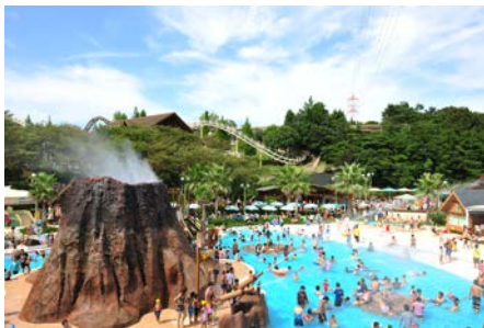
アクア・アドベンチャー

鈴鹿サーキットの夏は、夜までたっぷり、家族みんなで「できた!が、いっぱい。」を体感いただけます。