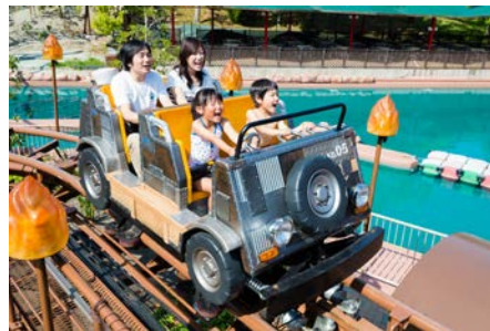
水着でアトラクション